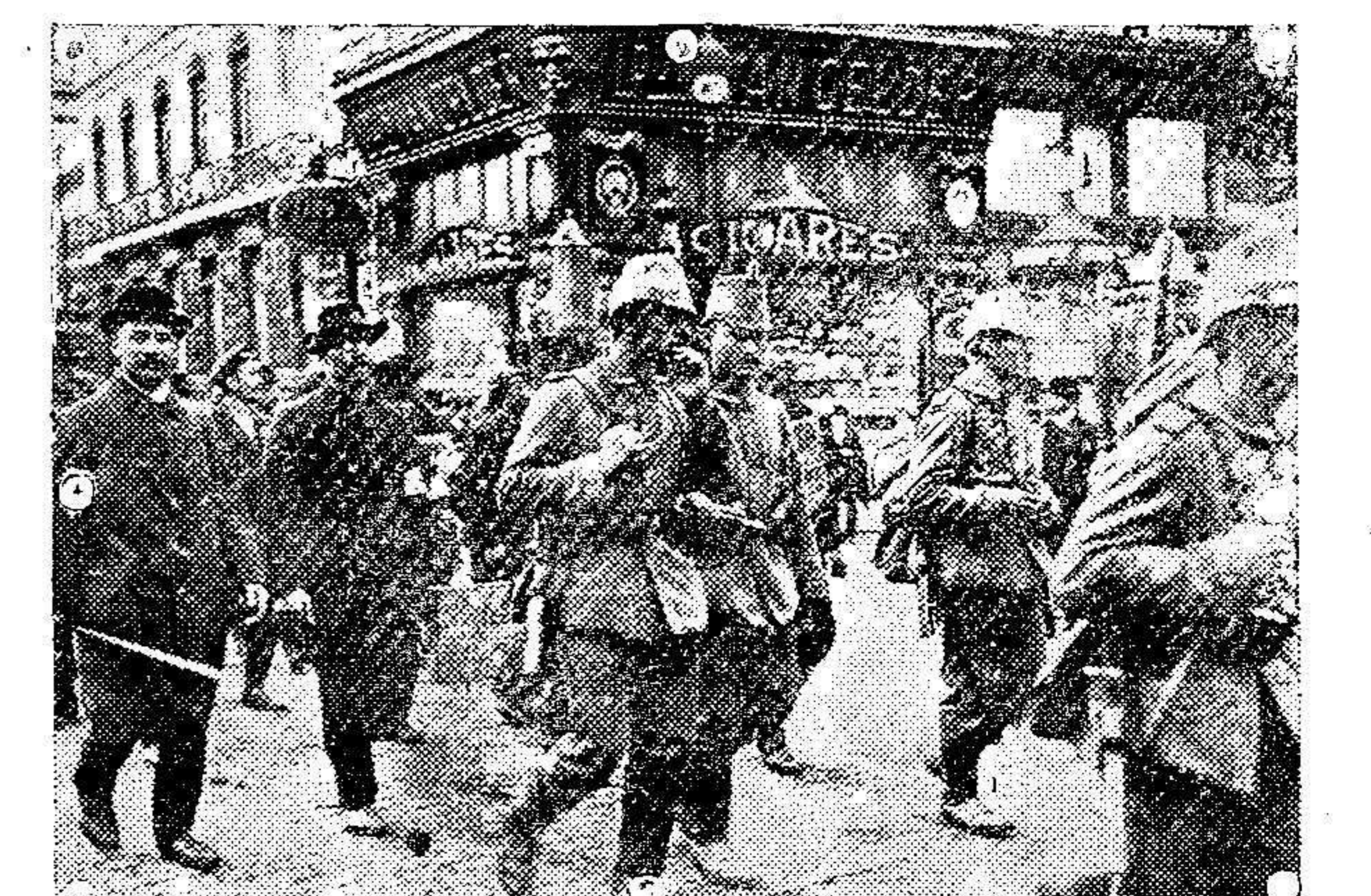
Soldados de un destacamento al pasar por el bulvar Auspach, de Bruselas.