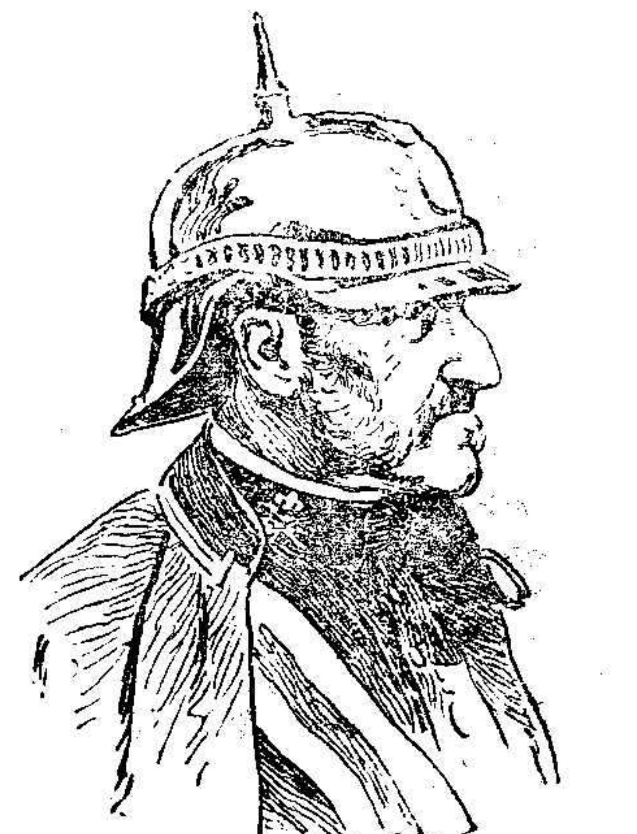
El Capitán General Sr. Weyler

Se trata de elementos muy valiosos que han de favorecer no poco la causa de España en este territorio.