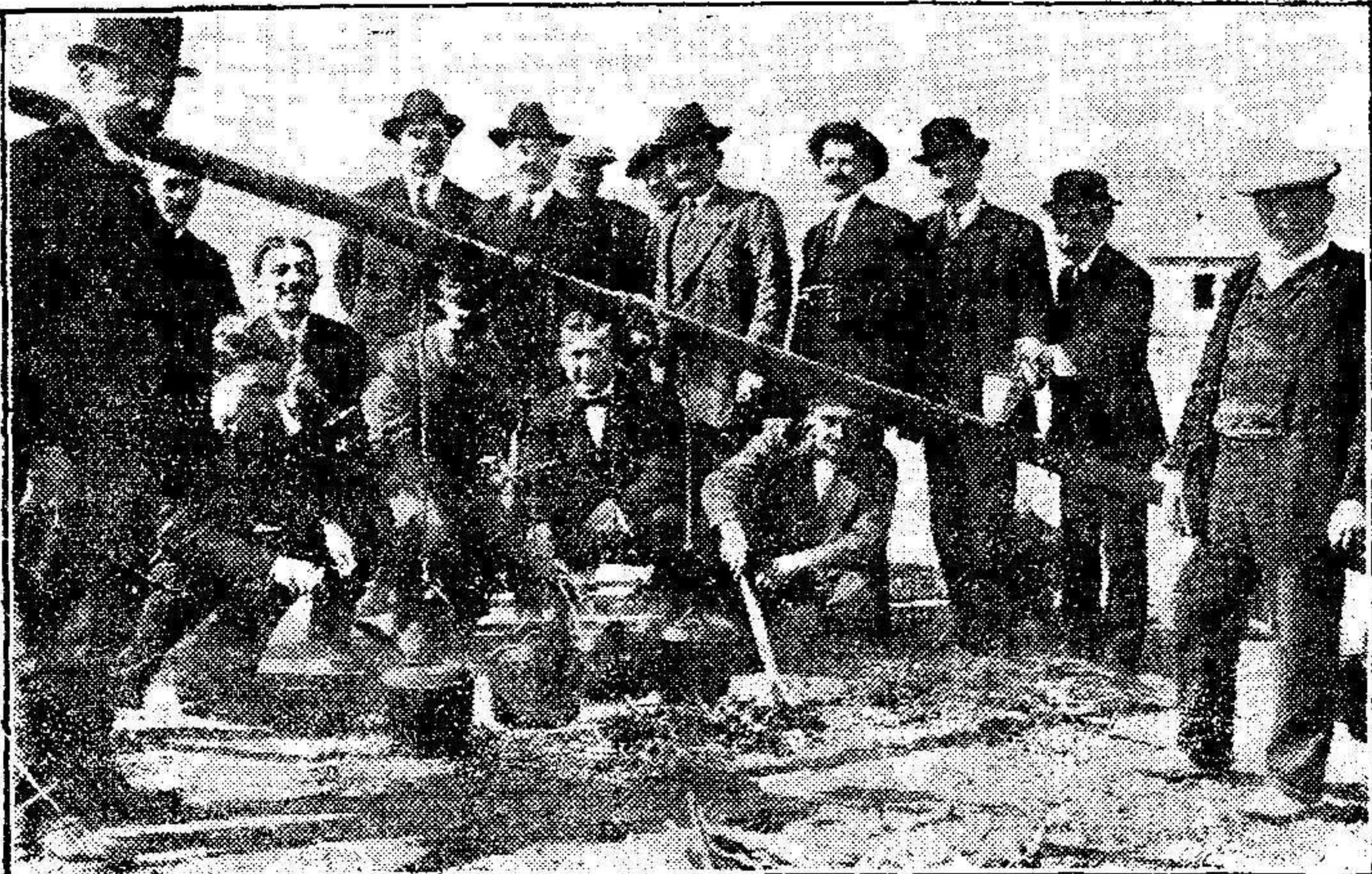
Varios socios examinando la «paella»