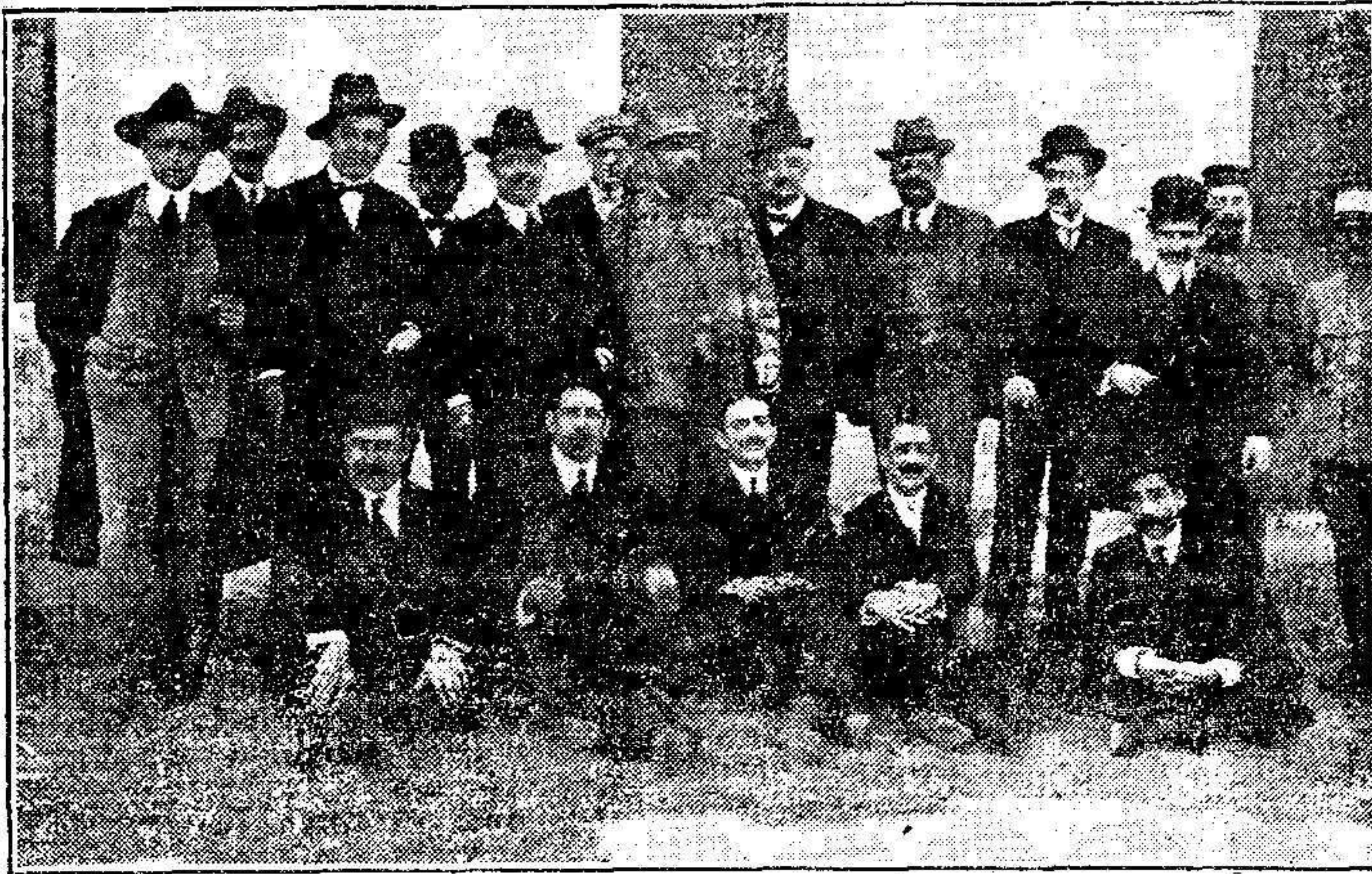
Grupo de los socios de la Asociación de la Prensa de Melilla