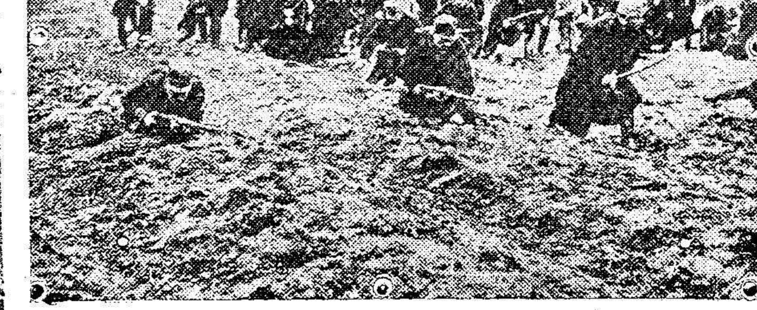
Una avanzada de la infantería austriaca en el Trentino

Recija su desconsolada familia nuestro pésame.