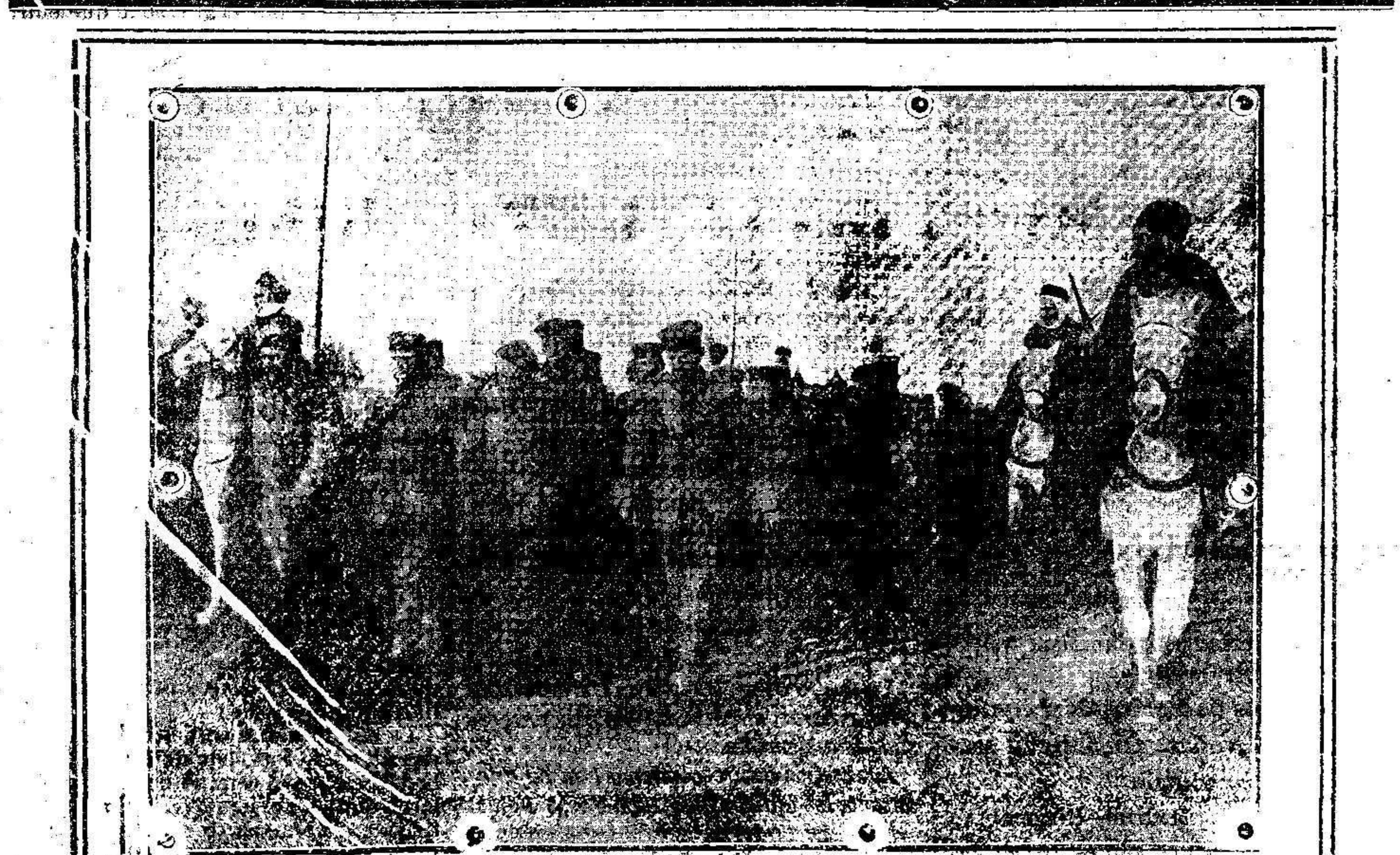
Una conducción de prisioneros

Parada, los cuerpos de la guarnición. Principal, cuartel de Santiago.