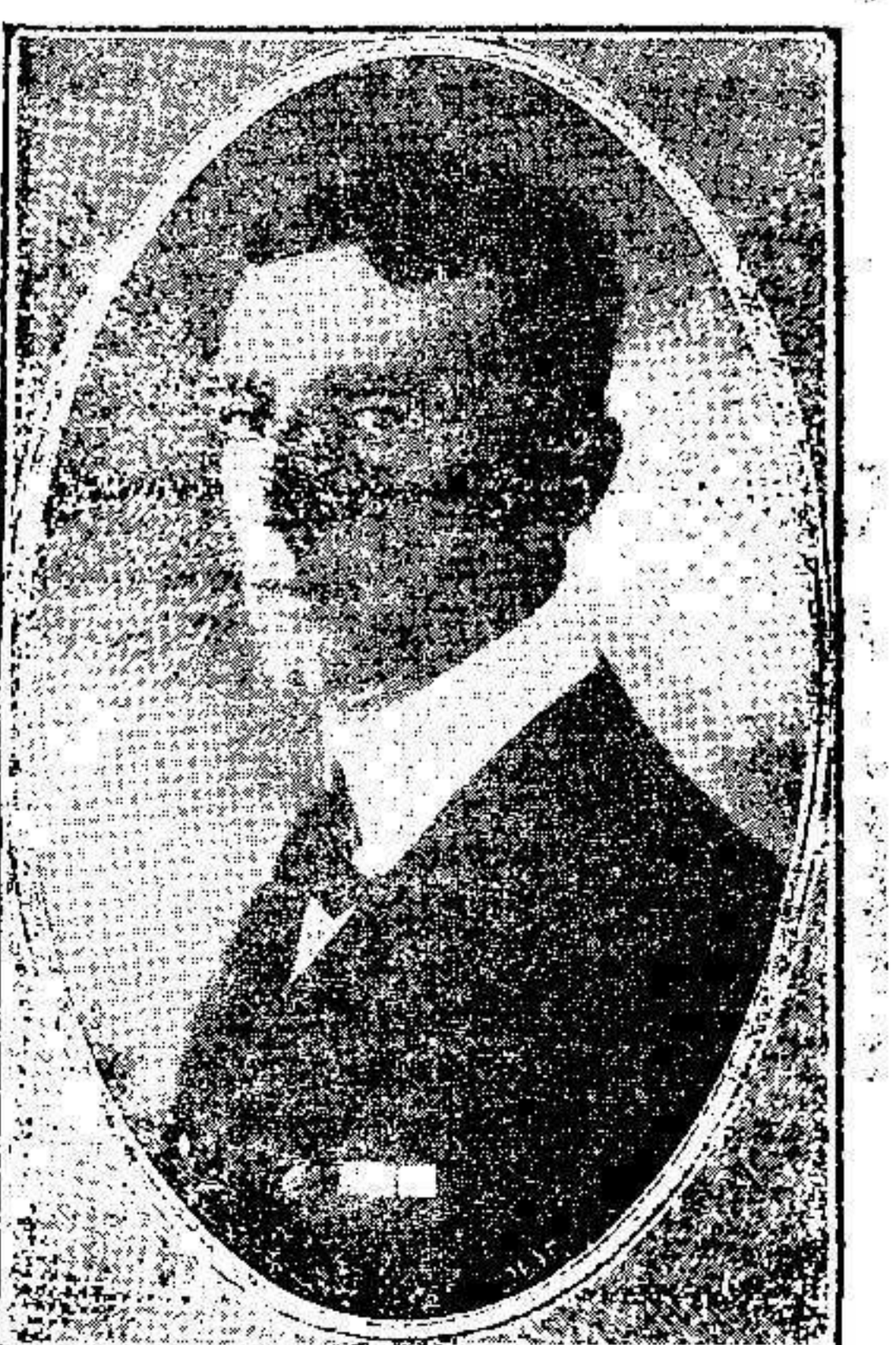
El Principe Gaullier de Sueda, casado con la princesa María (née) gran duquesa María Paulova, que se han divorciado.

El regreso lo efectuarán por la tarde, desfilando guíamente por ante la Comandancia general, los batallones que se alojan en Sanzugo y Cabrillas.