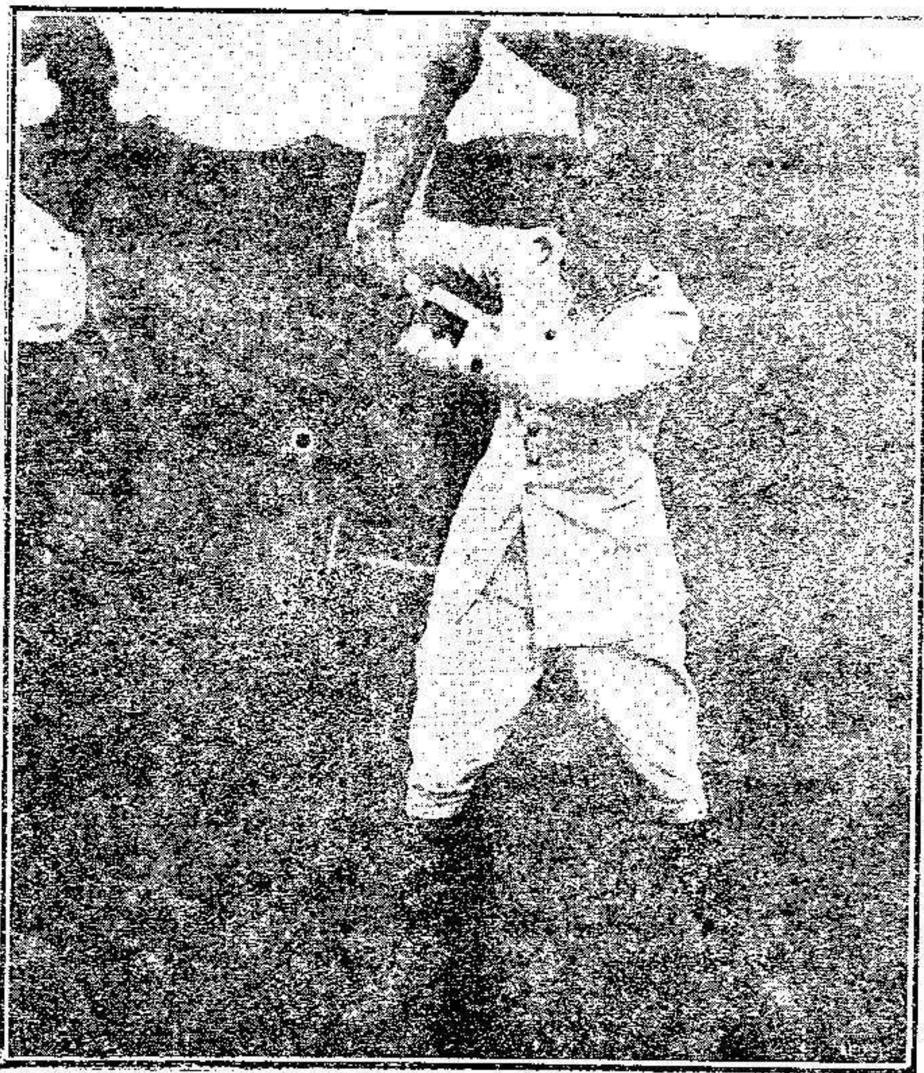
S. A. el Infante D. Alfonso trabajando en el campamento de los avladores.