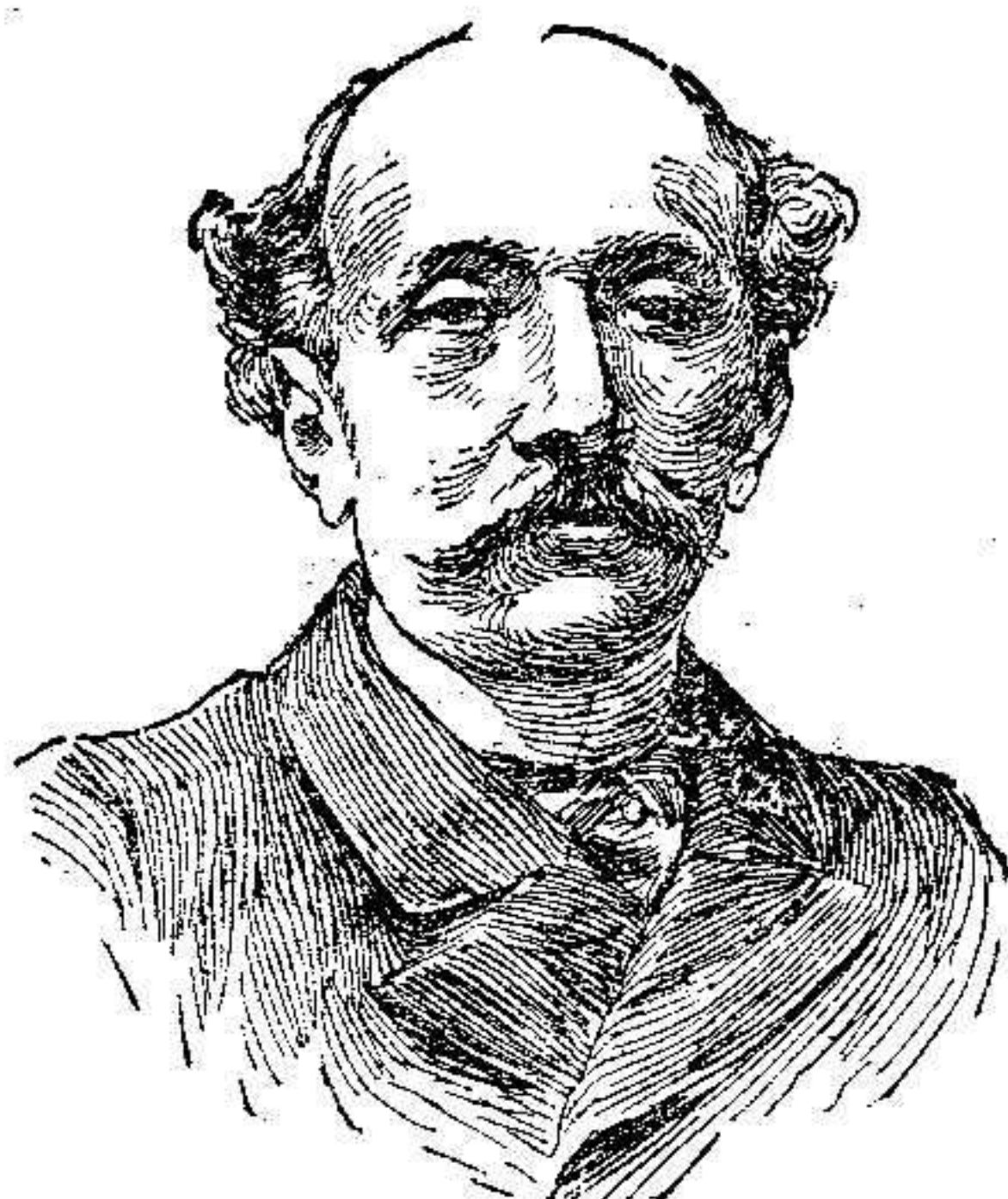
Don Eduardo Dato.

Pancilliet de pura almendra igual á los de Barcelona en la Confrería Los Alpes Granadinos 841