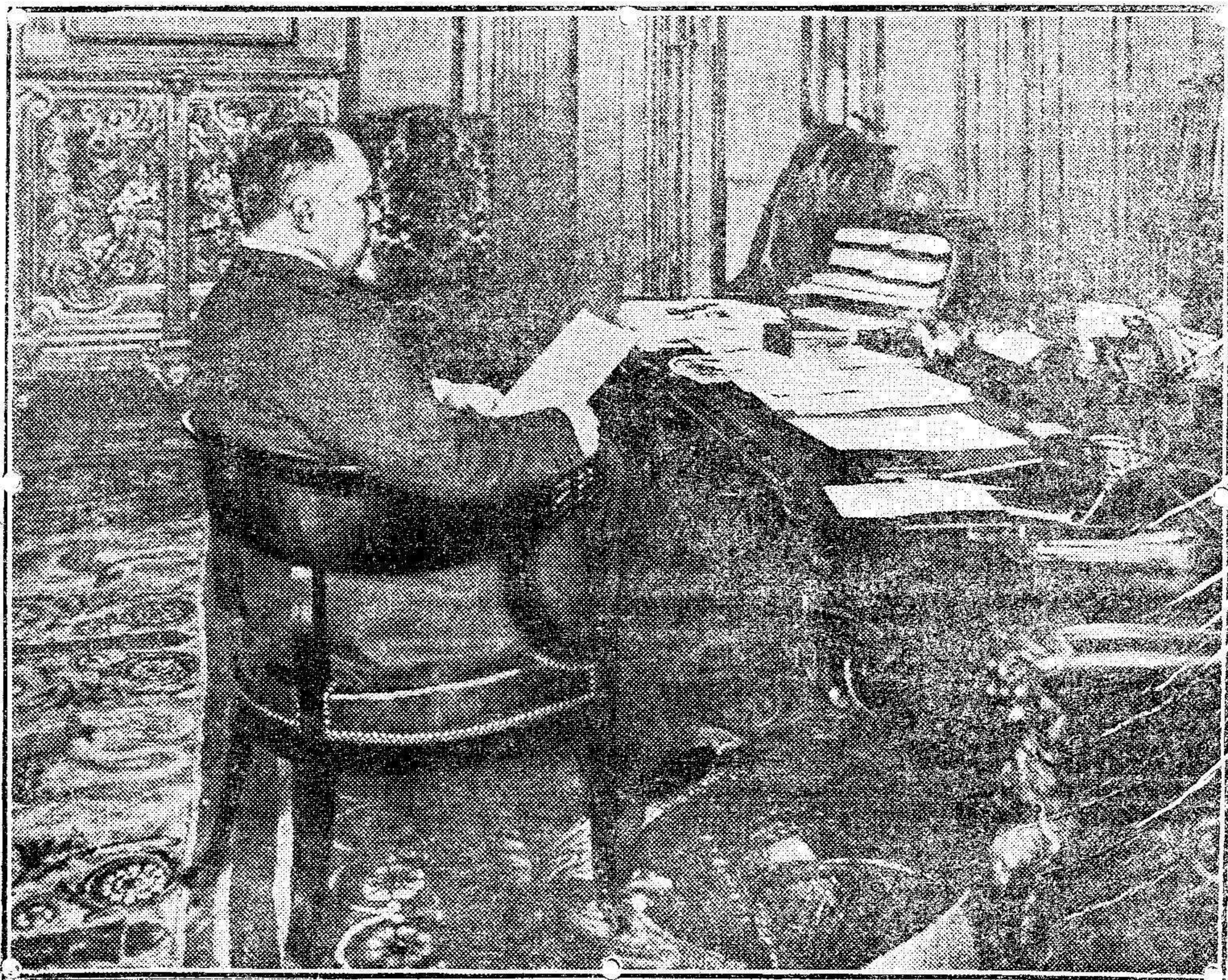
El Presidente de la República francesa, señor Poincaré, en su despacho del palacio del Eliseo

Pero ya que no sea posible esa colaboración europea, saludemos á la colaboración franco-española y esforcémonos todos á fin de que tenga la eficacia anhelada, para el más fácil logro de los ideales que en Marruecos persiguen las dos naciones amigas mandatarias del mundo civilizado en el imperio mogrebino.