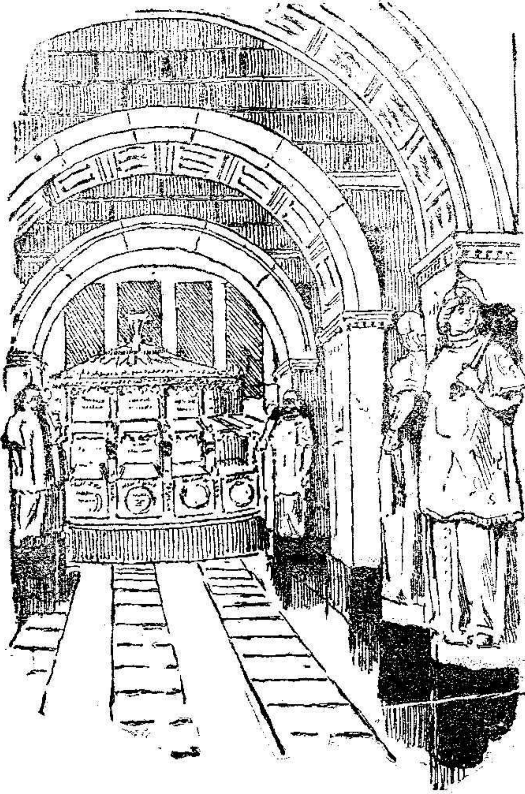
Entrada al panteón de Infantes, donde está el sepulcro de la Infanta María Teresa