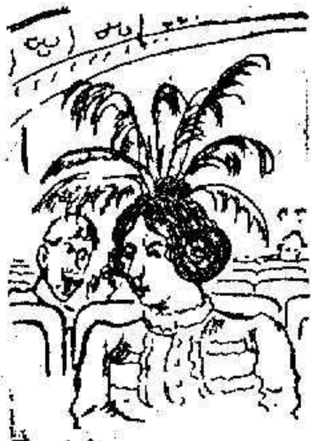
Adorno de cabeza para Teatro.