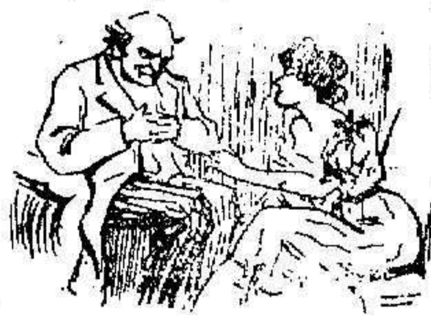
EN EL CANTANTE