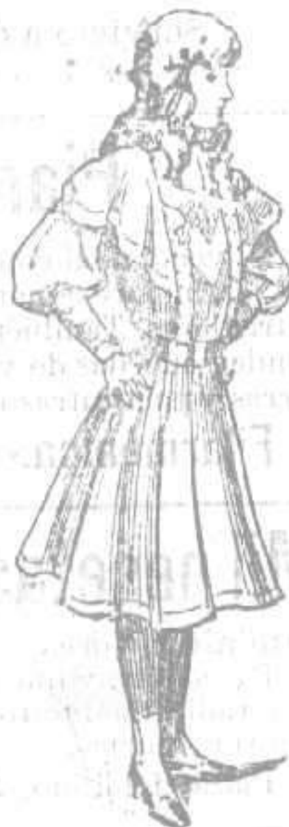
Elegante traje para niña, propio para paseo, teatro y visita

Cuerpo abierto; en su centro artísticas puntillas. Caprichosas hombreras recortadas. Manga hueca; puño largo. Cinturón de cuero. Falda á pliegues.