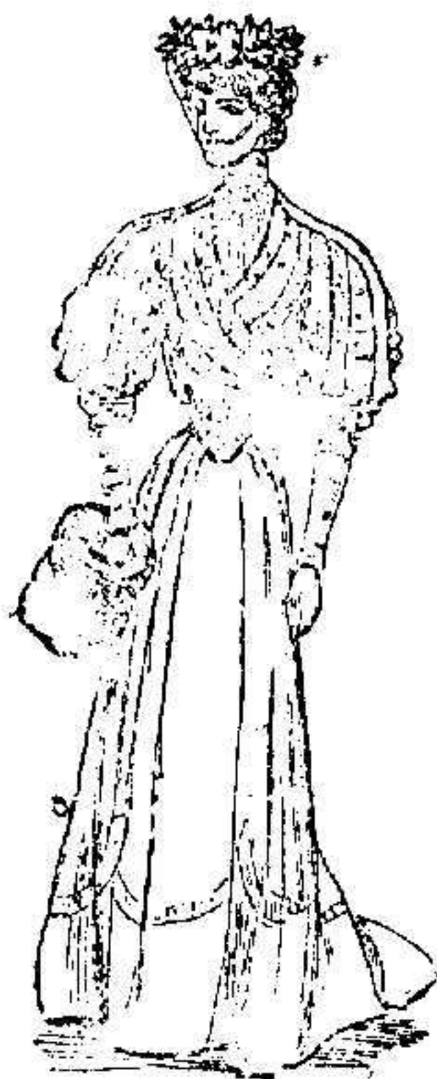
Vestido de visita para señorita

De paño, color plateado. Cuerpo formando doblé pliegues, con galón de seda del mismo tono; cruzado con hilos de plata. Adornos color violeta. Plastrón de muselina de seda blanca. Cinturón de terciopelo. Falda lisa con adornos malva.