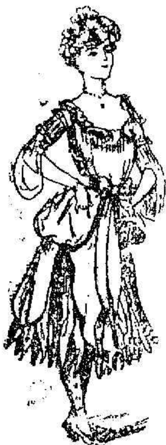
Disfraz de Narciso.

(Para jovencitas de doce á catorce años).