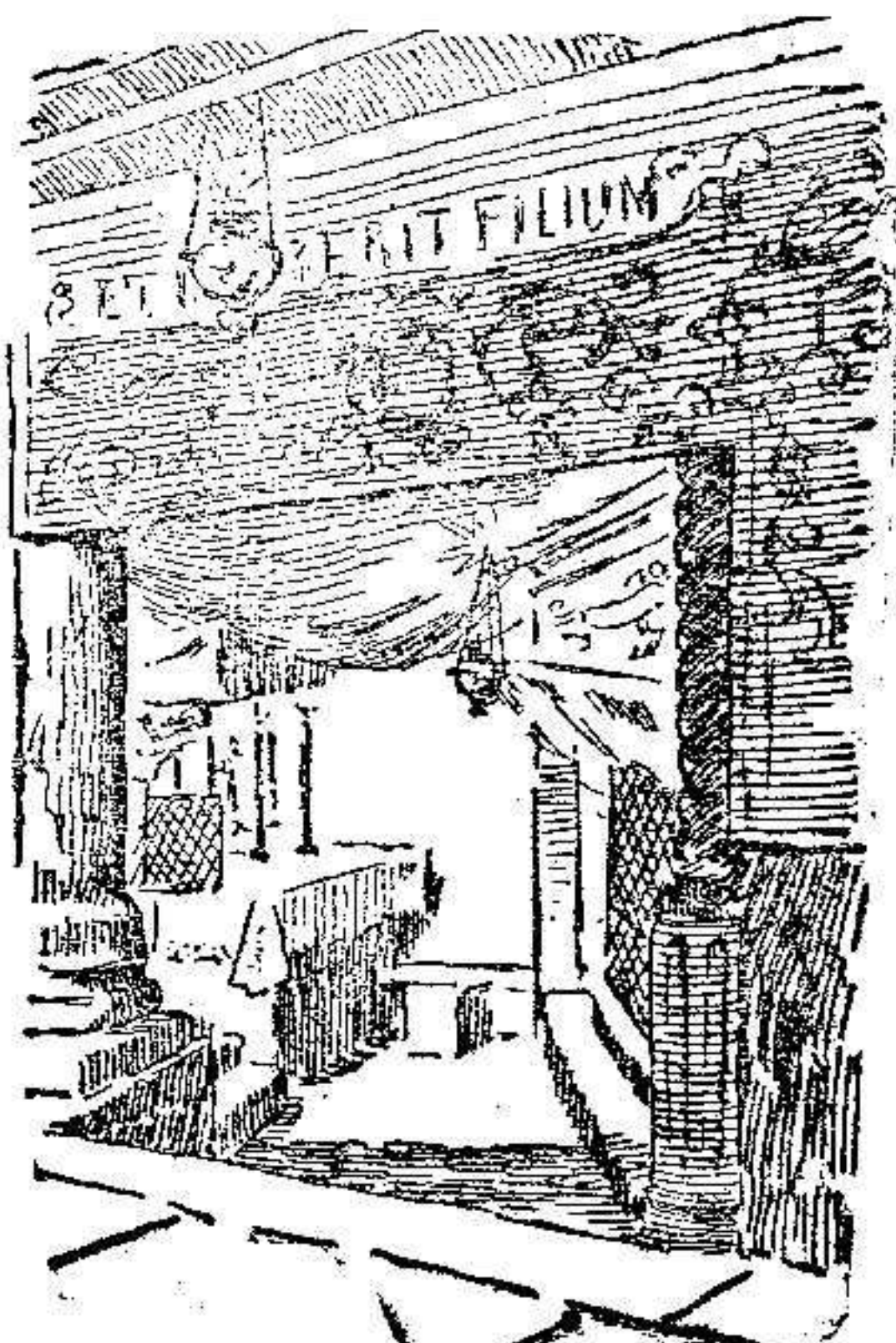
Altar y nicho del pesebre

En el interior, también más que ver, se advierten sus líneas generales. Traspuerta la entrada se penetra en un salón, cuyo techo de desahucado maderamen sostiene cuatro columnas de piedra. Es un lugar donde se conversa y fama, donde los niños gritan y corren, los vendedores vociferan sus mercancías piadosas, como rosarios, á profanas, como confituras, y los soldados turcos cosean sus ridos uniformes, mientras cruzan indiferentes monjes griegos y frailes franciscanos.