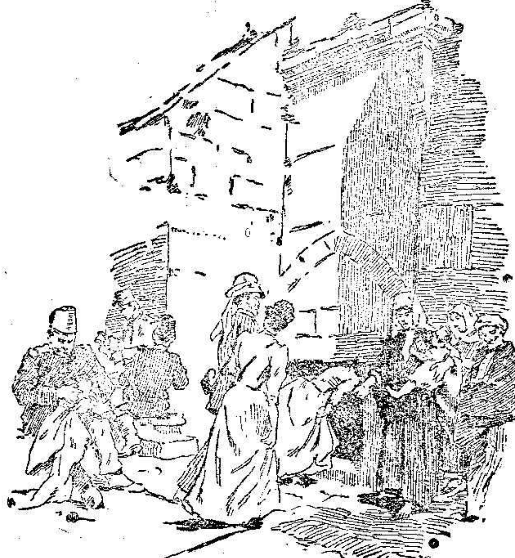
Entrada á la Basílica