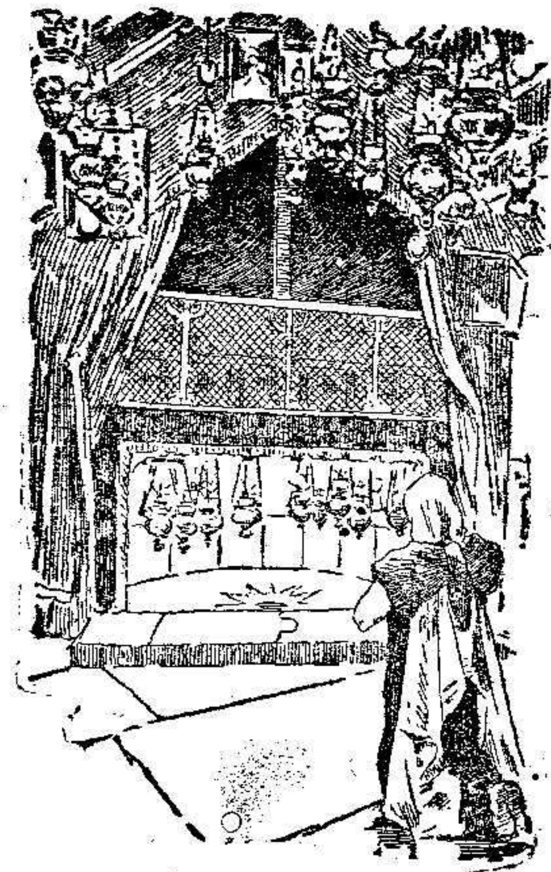
Nicho del Nacimiento