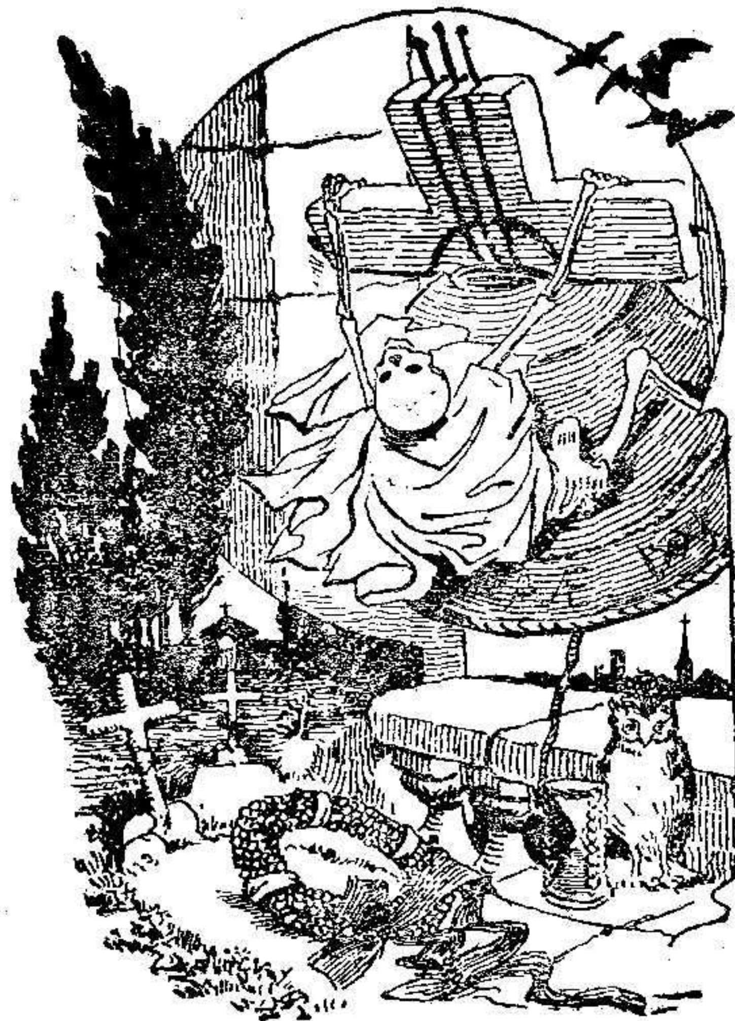
Algeria de la conmemoracion de los fieles difuntos

La Iglesia dedica en el día de hoy un recuerdo piadoso á la sagrada memoria de los que nos precedieron, por desgracia ó por fortuna, en el viaje al mundo de la eternidad.