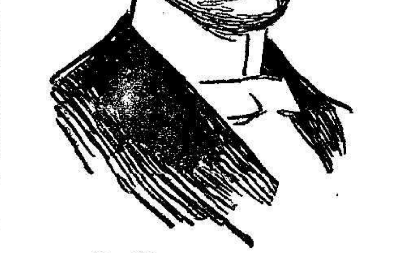
Sr. Figueroa Alcorta

La popularidad del nuevo presidente y el acierto con que su antecesor ha cumplido sus deberes presidenciales, son motivos para que la Argentina festeje por igual á D. José Figueroa Alcorta, presidente saliente, y á D. Roque Sáenz Peña, su sucesor.