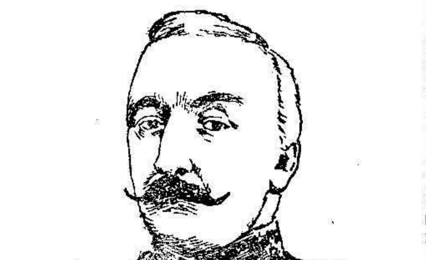
Sr. Saenz Peña

Se ha dado las órdenes oportunas para que sea prohibida la venta de pescado muerto con dinamita.