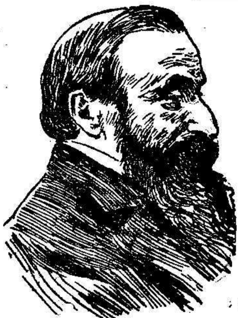
Guerra Junqueiro, insigne poeta y uno de los más prestigiosos republicanos portugueses

ciertas amenazas, que algunos se dan prisa en recordar en el Parlamento; no por ciertas amenazas que no puede admitir ni la virilidad ni el honor del pueblo español, por los obstáculos que encontrara para el ejercicio de esa acción militar si la necesitase entonces ó mañana la Nación española, porque de esas dificultades, de esas asperezas nacidas del desprecio á la Patria, del desamor á la Patria, de la desintegración