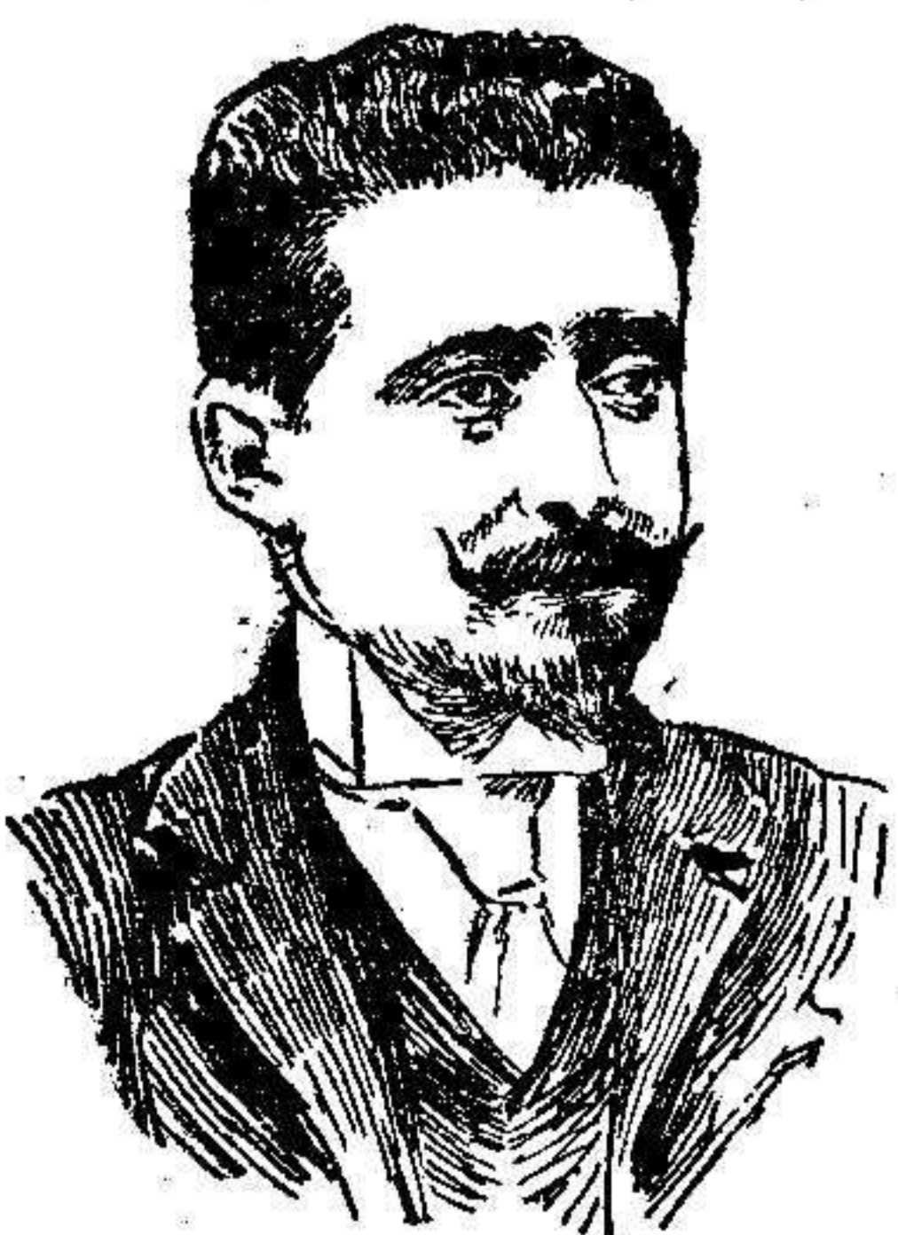
Alfonso Costa, ministro de Justicia

Momentos después de celebrada la subasta para la adquisición de solares, antes pertenecientes al Estado, por los particulares, escribimos unas cuartillas en réplica de que se hiciera á los adjudicatarios la gracia de eximirlos de la tarifa general en el pago del impuesto de derechos reales, considerán-