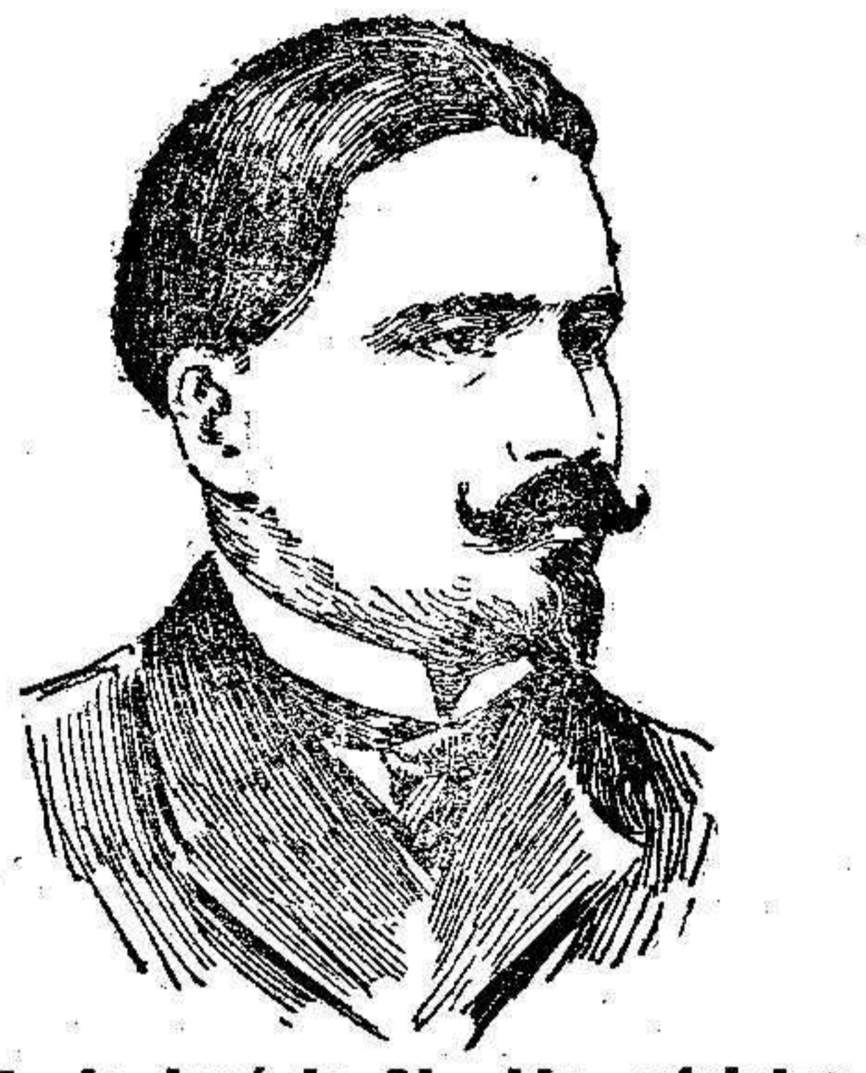
Antonio José de Almeida, ministro de la Gobernación de la República portuguesa

nos reunimos en la segunda caseta para testimoniar nuestro amor á aquella Virgen bendita, tesoro de veinte siglos que se dignó poner sus plantas en las orillas del caudaloso Ebro, y para recibir tributo de cariño á nuestros soldados con el donativo que la comisión distribuyera.