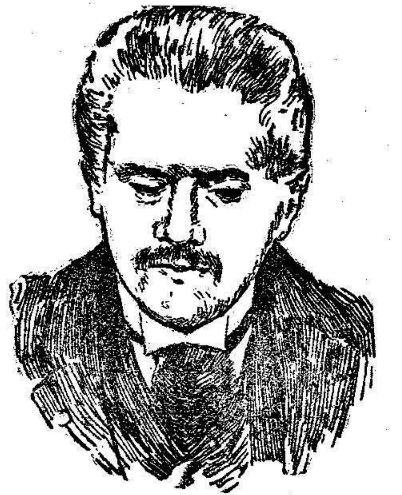
Teófilo Braga, presidente del gobierno provisional de la República portuguesa.