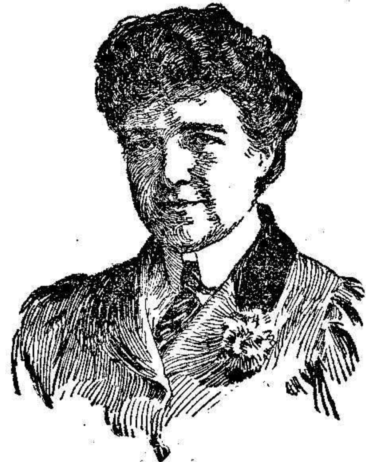
La Reine Amelia