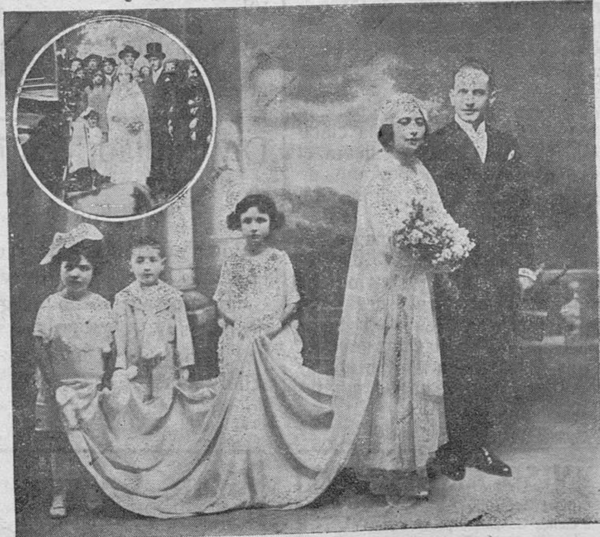
Los recién casados en la fotografía de Emiliano, después de la ceremonia nupcial. En el círculo, al salir de la iglesia, disponiéndose a subir a su automóvil.