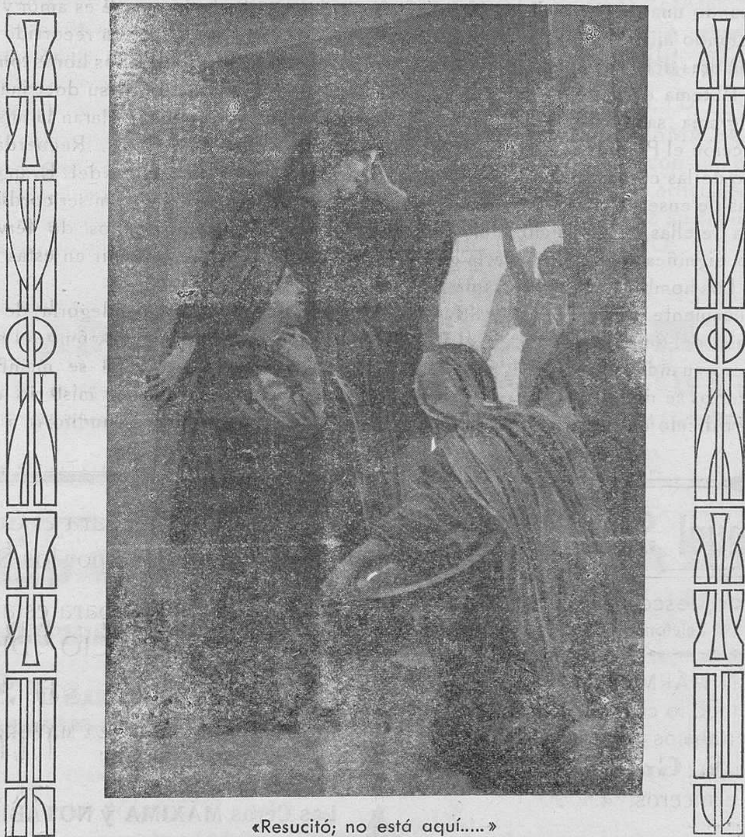
«Resucitó; no está aquí....»

Todo el que vive, vive de una manera determinada, no puede sustraerse al ateneante problema de la vida. Uno de los caminos que siguen los hombres es el de la vida desorganizada . Tales son aquellos que llevan una vida incoherente en sus actos, que se proclaman