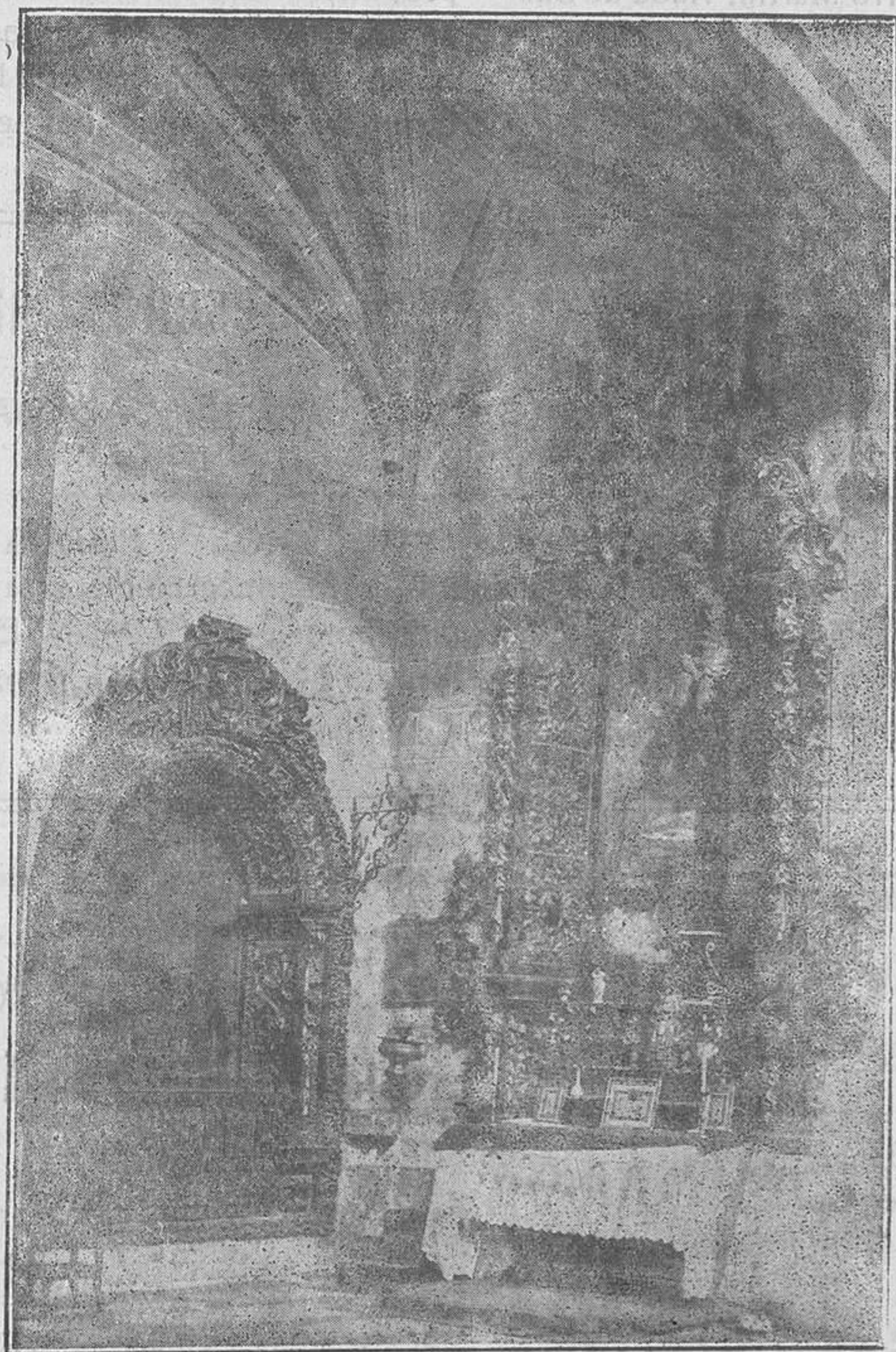
Altar del Sto. Cristo del Enlozado y Sepulcro del Obispo D. Pedro Díaz