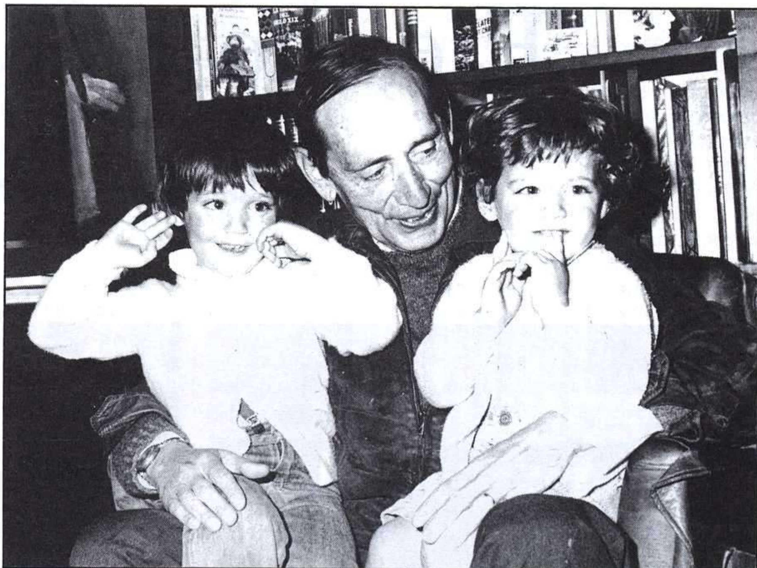
El escritor vallisoletano con dos de sus nietos.

parte que la escasez de novelistas de veinte años en nuestros días, contrariamente a lo que sucedió en los años cuarenta, responde a la crispada impaciencia de la juventud actual, ávida de resultados inmediatos, que es como decir poco proclive a abordar una tarea cuyo fin no se barrunta para antes de uno o dos años. La misma disposición trasluce el niño que lee. A un niño que lee, que espontáneamente se sumerge en nuestra invención, no debemos aplazarle largo tiempo su desenlace ni desviarle del objeto de su atención porque va en contra de su naturaleza. En una palabra, aquí sí es obligado tener en cuenta que la distancia más corta entre dos puntos es la línea recta. Esto es, el relato ha de ser breve y lineal.