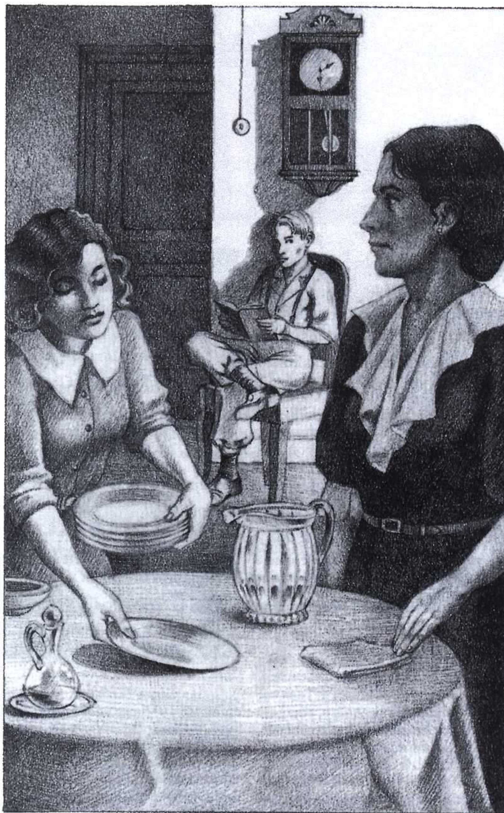
FUENCISIA DEL AMO, LAS BICICLETAS SON PARA EL VERANO, VICENS VIVES, 1996.

6. Esta obra es seguramente su último trabajo como actor en teatro, en la misma sala madrileña que hoy ostenta su nombre, el antiguo Centro