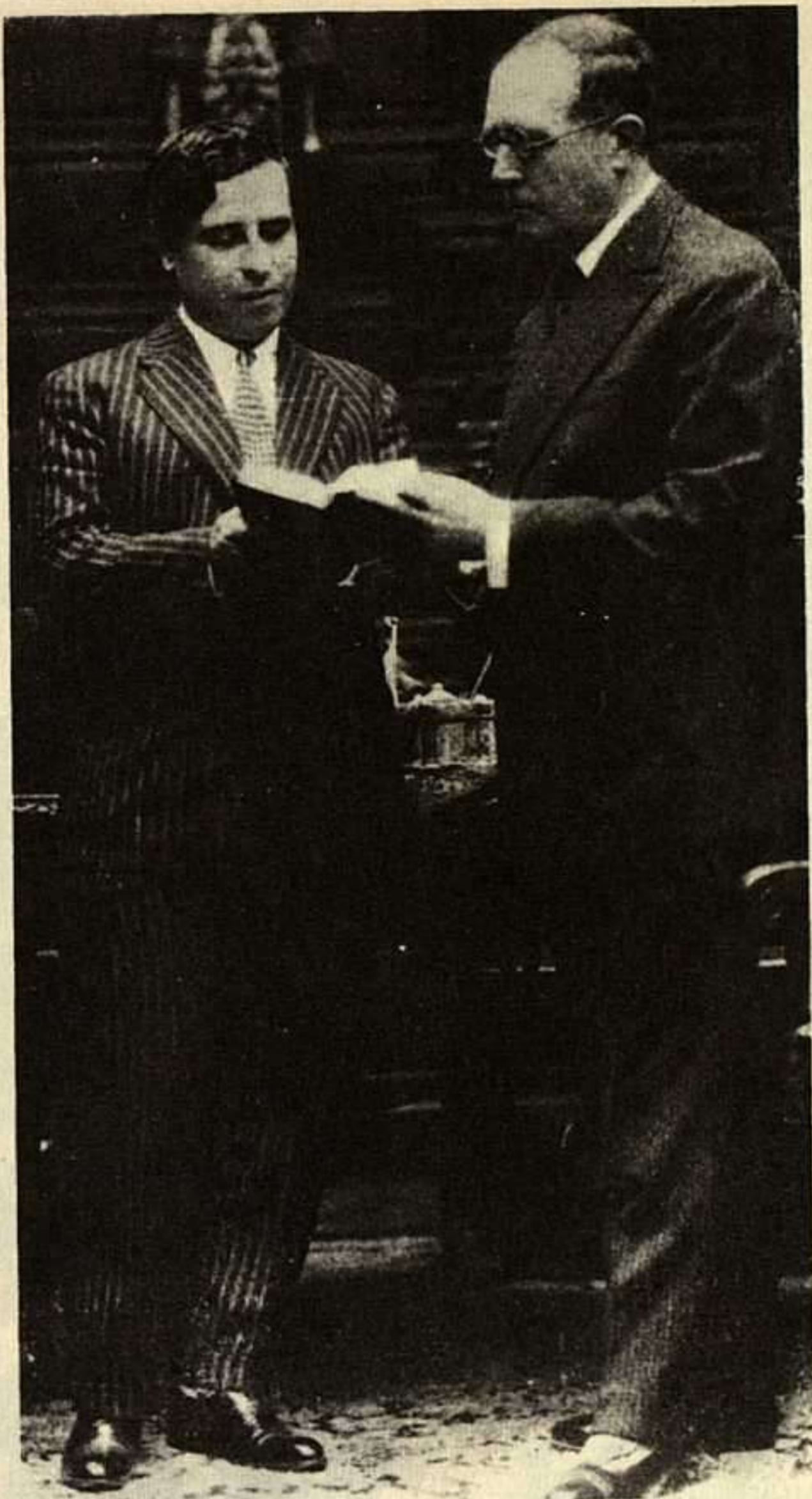
R. Gómez de la Serna y Azorín.

Período poético. Poesía. He aquí el nombre que resume maravillosamente el esfuerzo de los mejores artistas actuales. Procuraremos explicar las características esenciales de este movimiento.