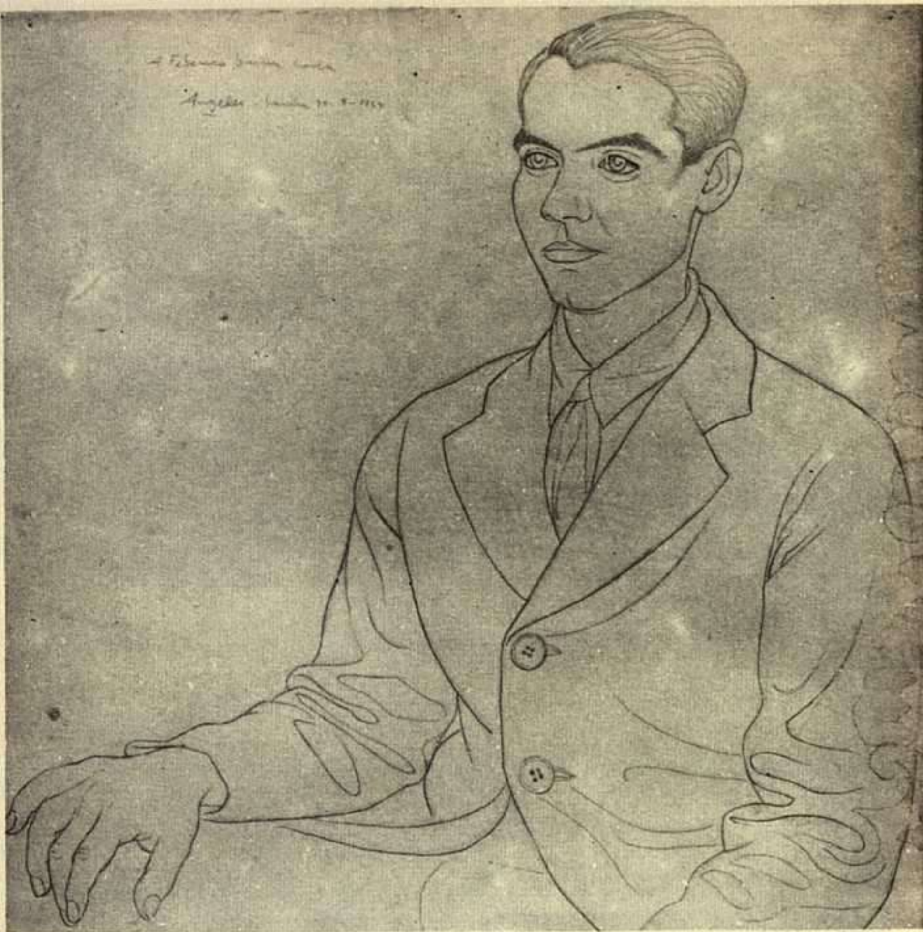
Federico García Lorca.