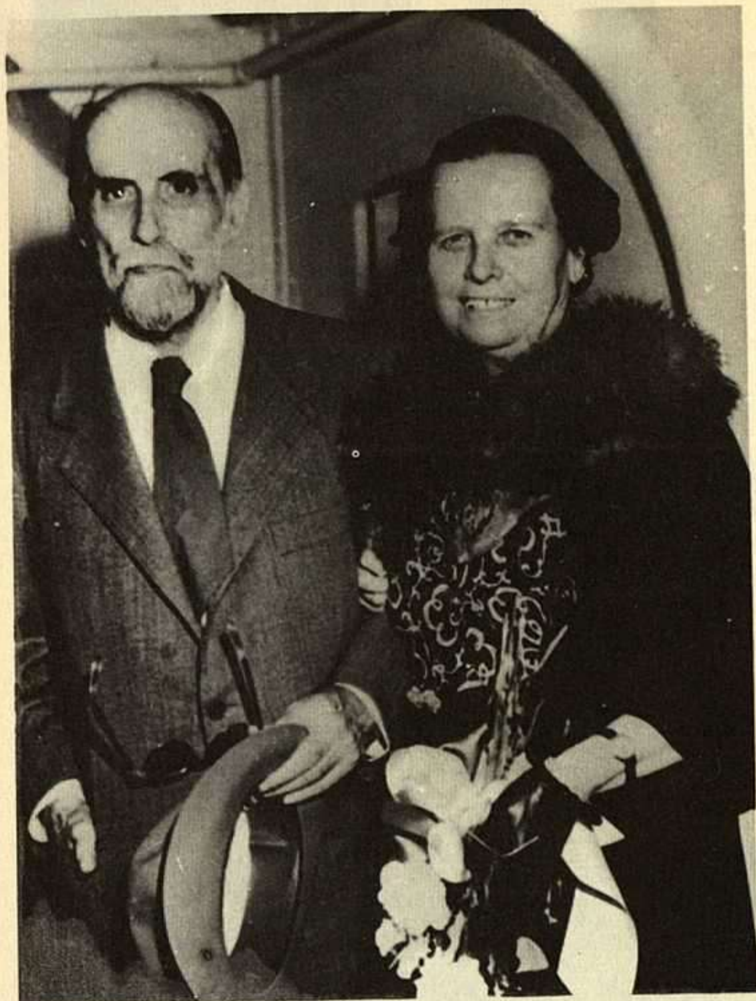
J. Ramón Jiménez y Zenobia Camprubí.