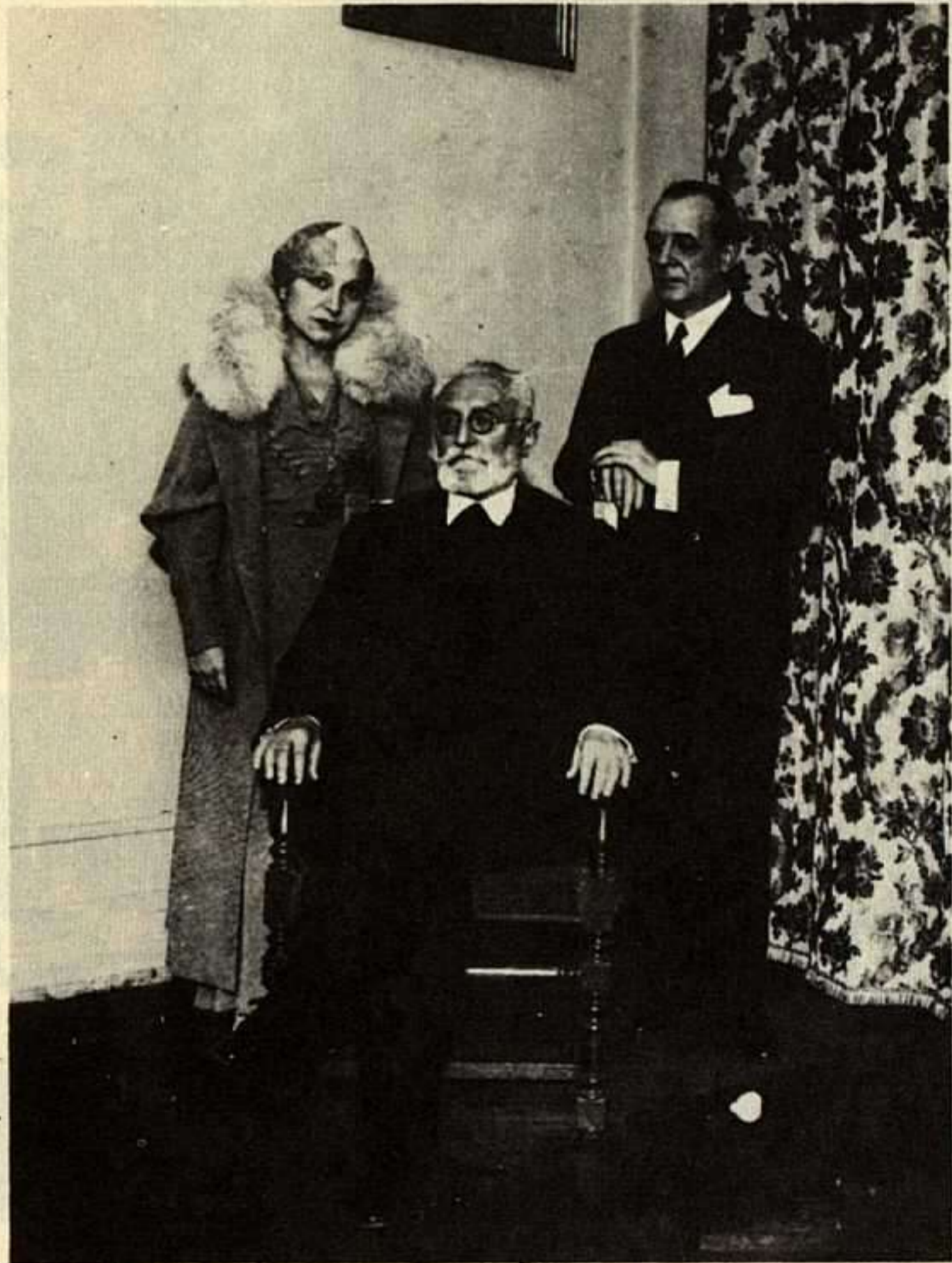
Unamuno con Margarita Xirgu y E. Borrás.

Estamos en constante lucha por la implantación de nuestros principios, para la destrucción de un sistema cansado. ¡Cómo no vamos a sacrificarlo también todo por el éxito de nuestras ideas! Después, cuando el mundo se afiance en nuevos cimientos, ya desaparecidas las luchas y las clases, sin proletarios ni burgueses, en ese día primero de un mundo mejor, comenzará la preparación cultural nueva que llegado cierto nivel creará su arte y sus artistas, y el artista a su vez creará su pueblo, y en esta justa correspondencia alcanzará la cultura su cielo más alto.