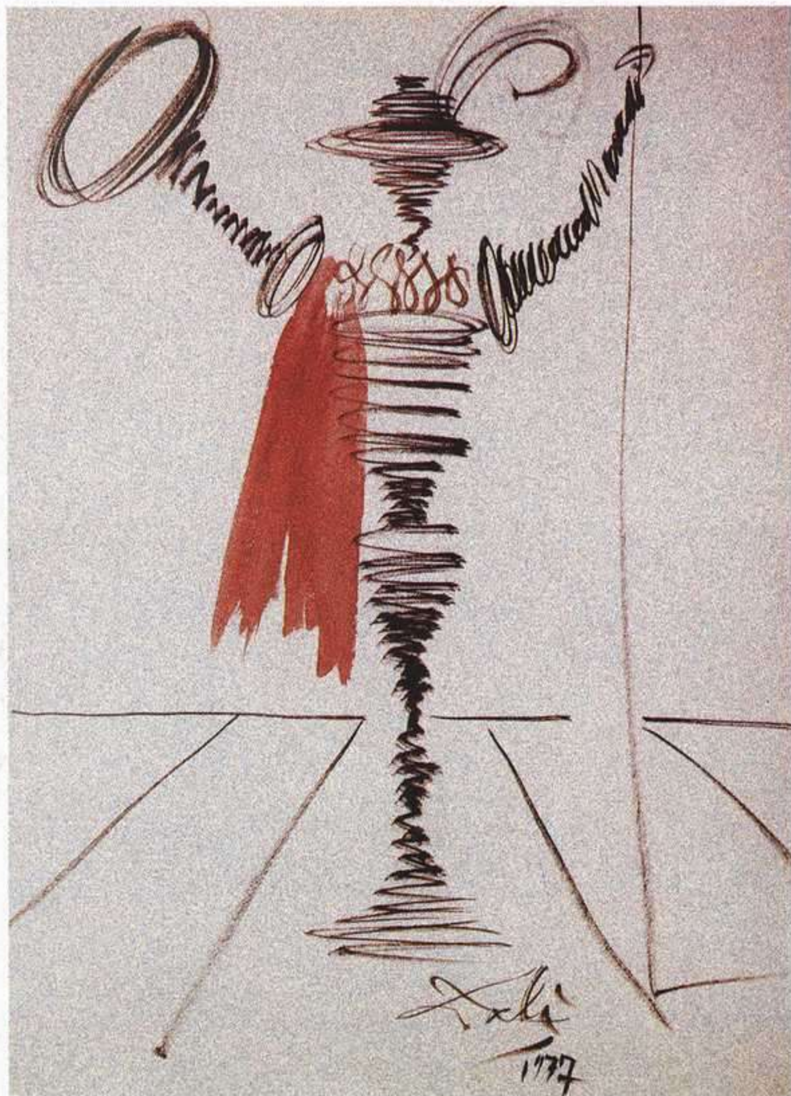
Salvador Dalí Caballero español, 1977

Si el cuerpo se alza en aire y el aire vuela, el aire que lo enciende salta en candela. Candente juego aire con aire, aire pero de fuego. (...)