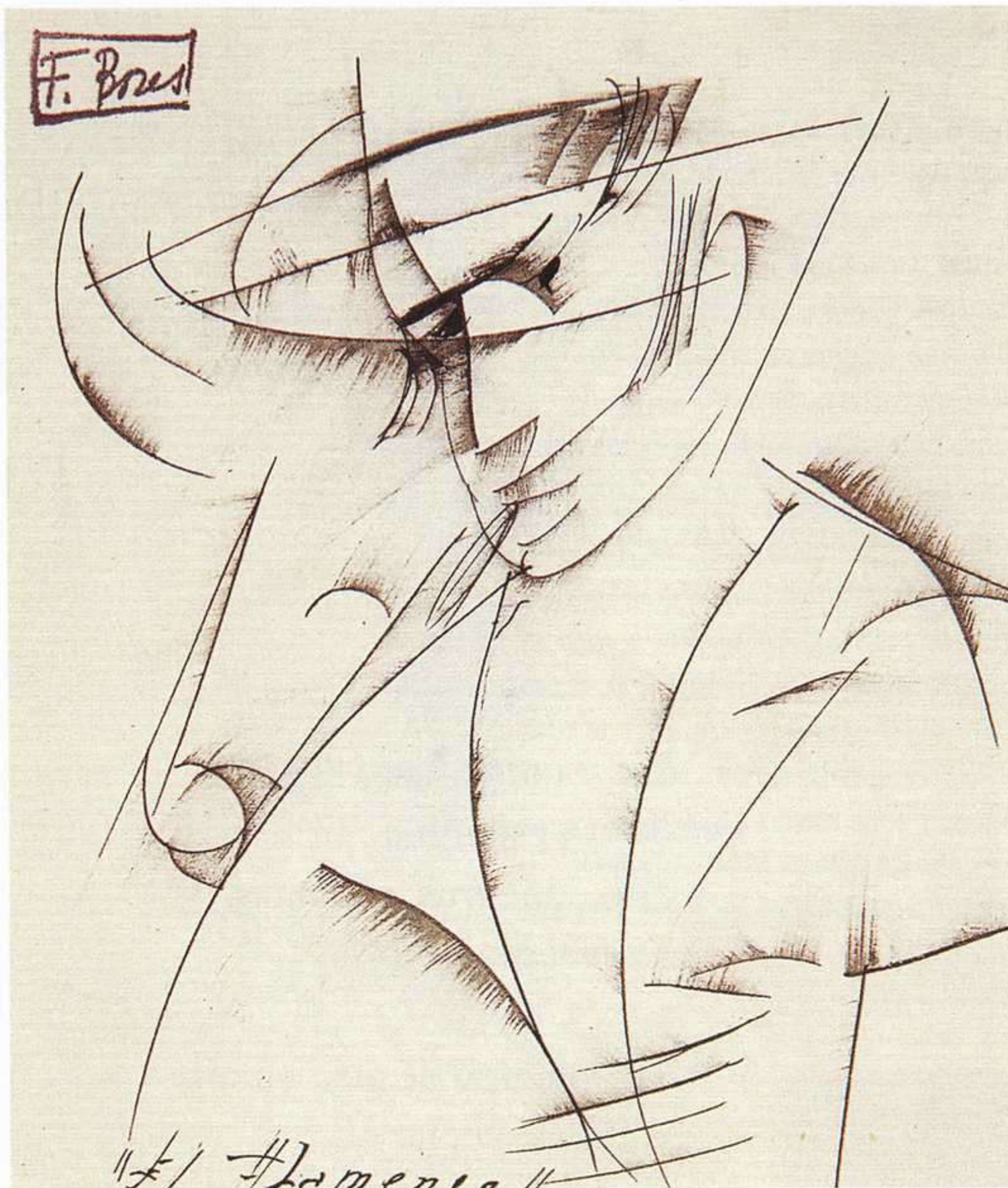
Francisco Bores El flamenco, 1921-22

Es inevitable, al hablar de la guitarra, leer a Federico: «Las seis cuerdas»