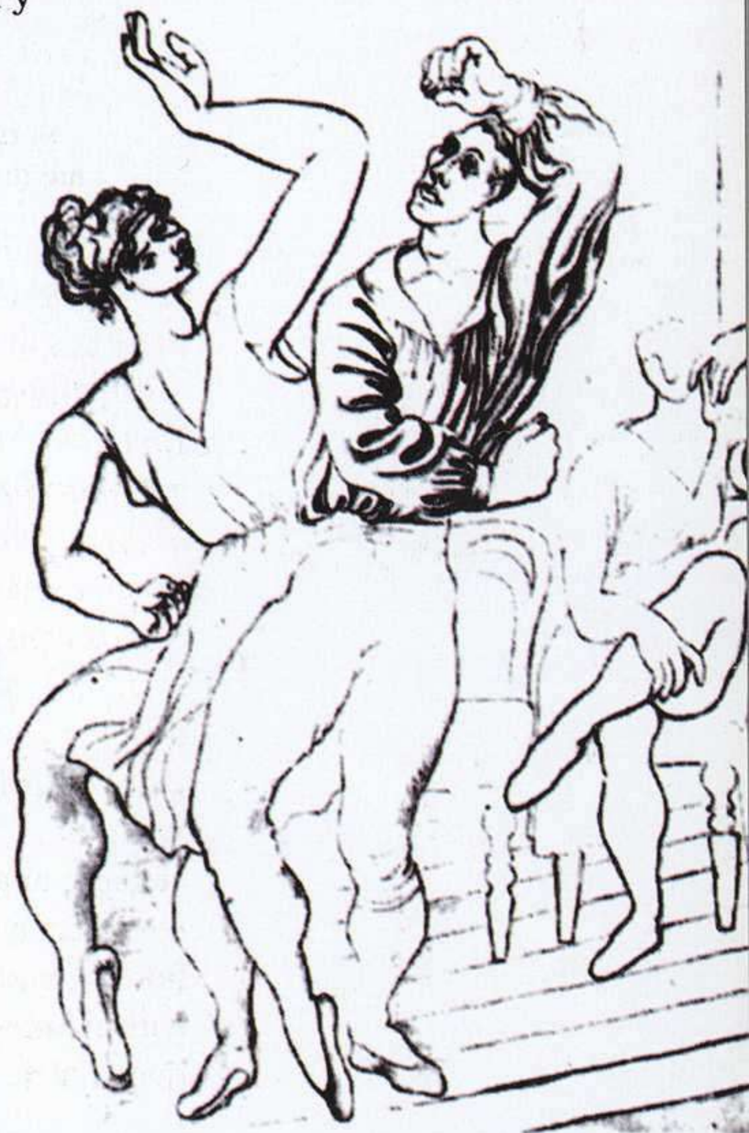
Pablo Picasso Félix El Loco