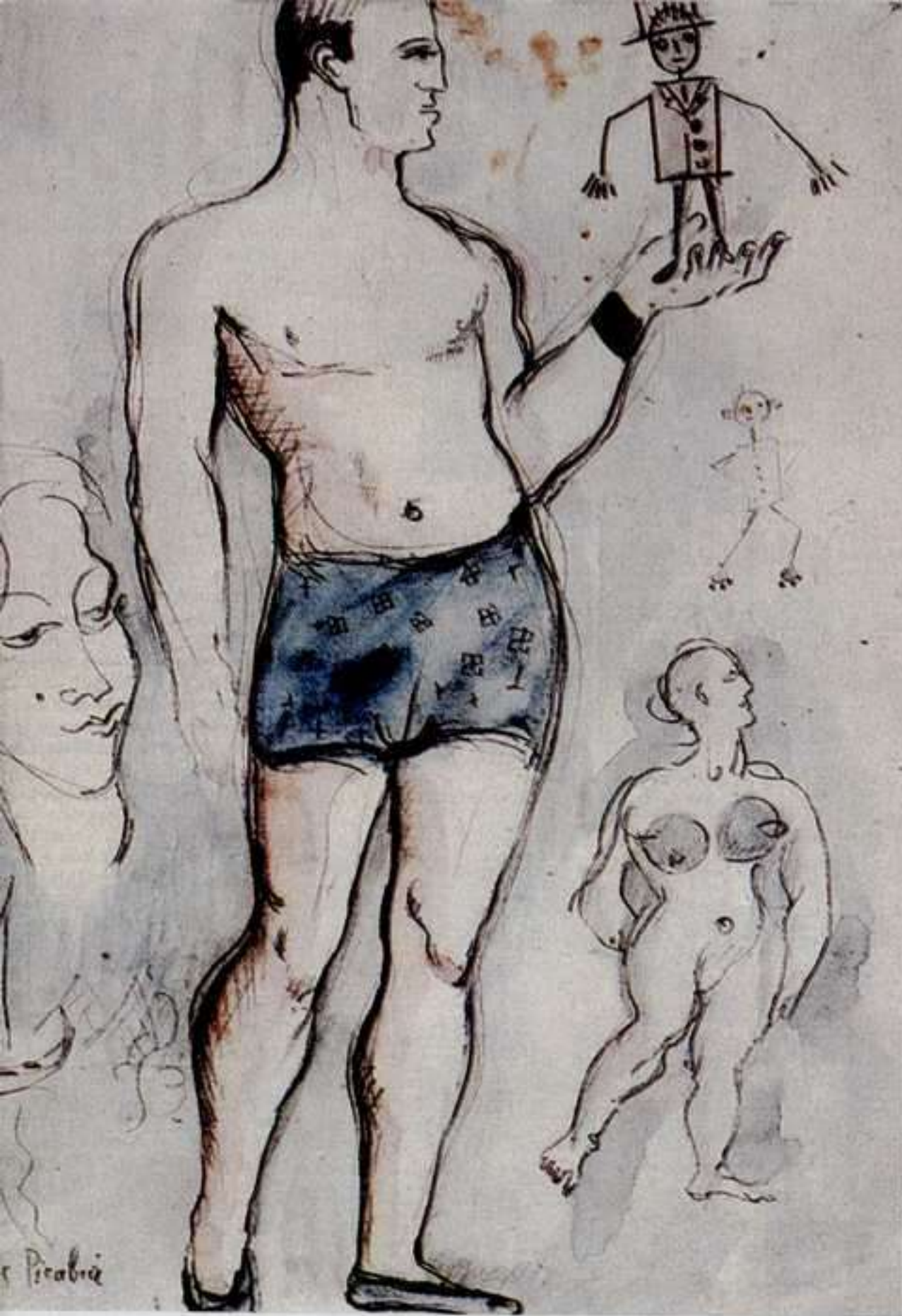
Francis Picabia Arthur Cravan H. 1920