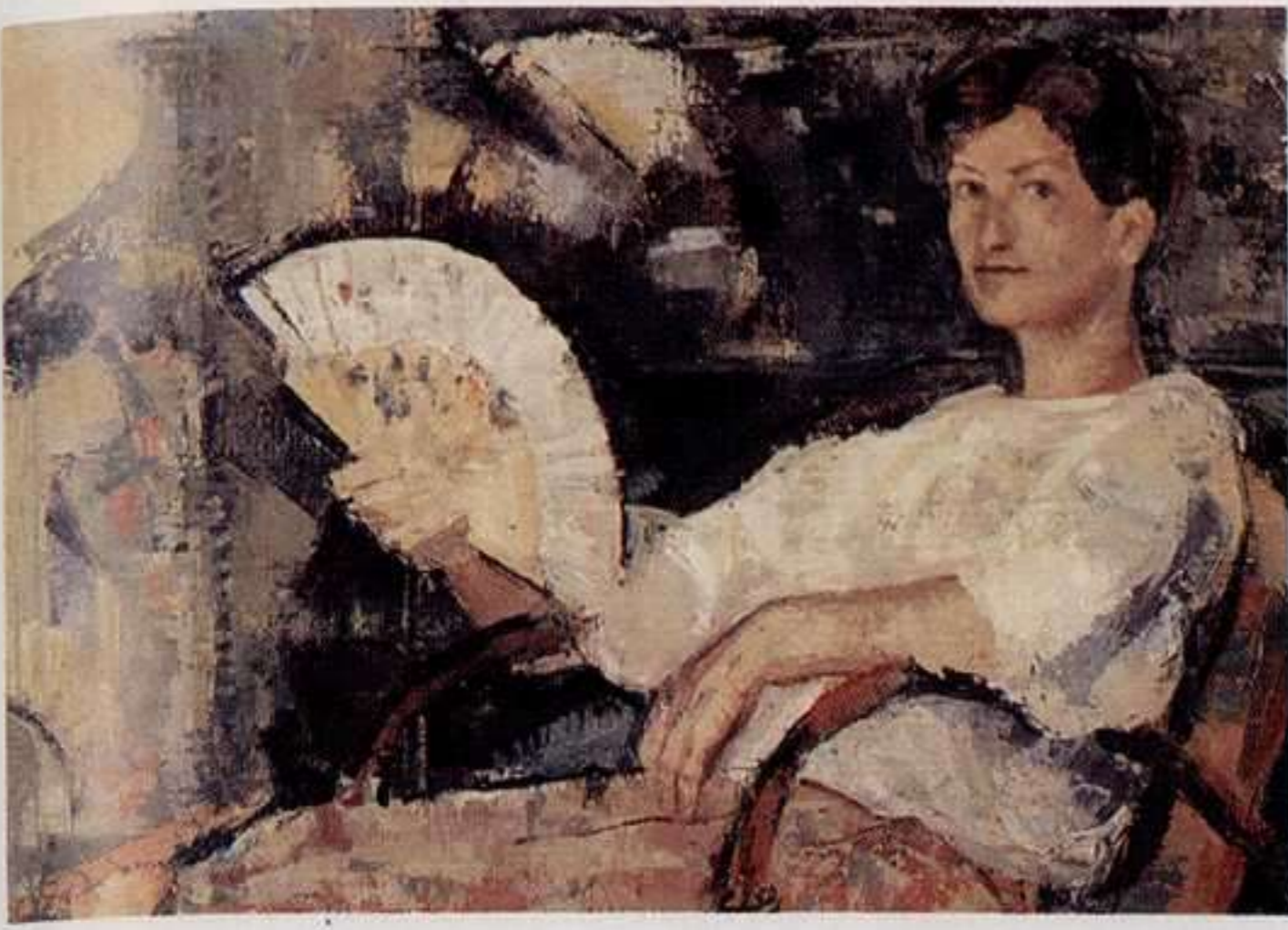
Alba por fin en la antología "La vida de frontera" ¿o algo - de esto si fue no me acuerdo - de "Las crónicas de Castilla"? Antonio Escobar -Tarde de verano- Oleo/lienzo 48 x 66