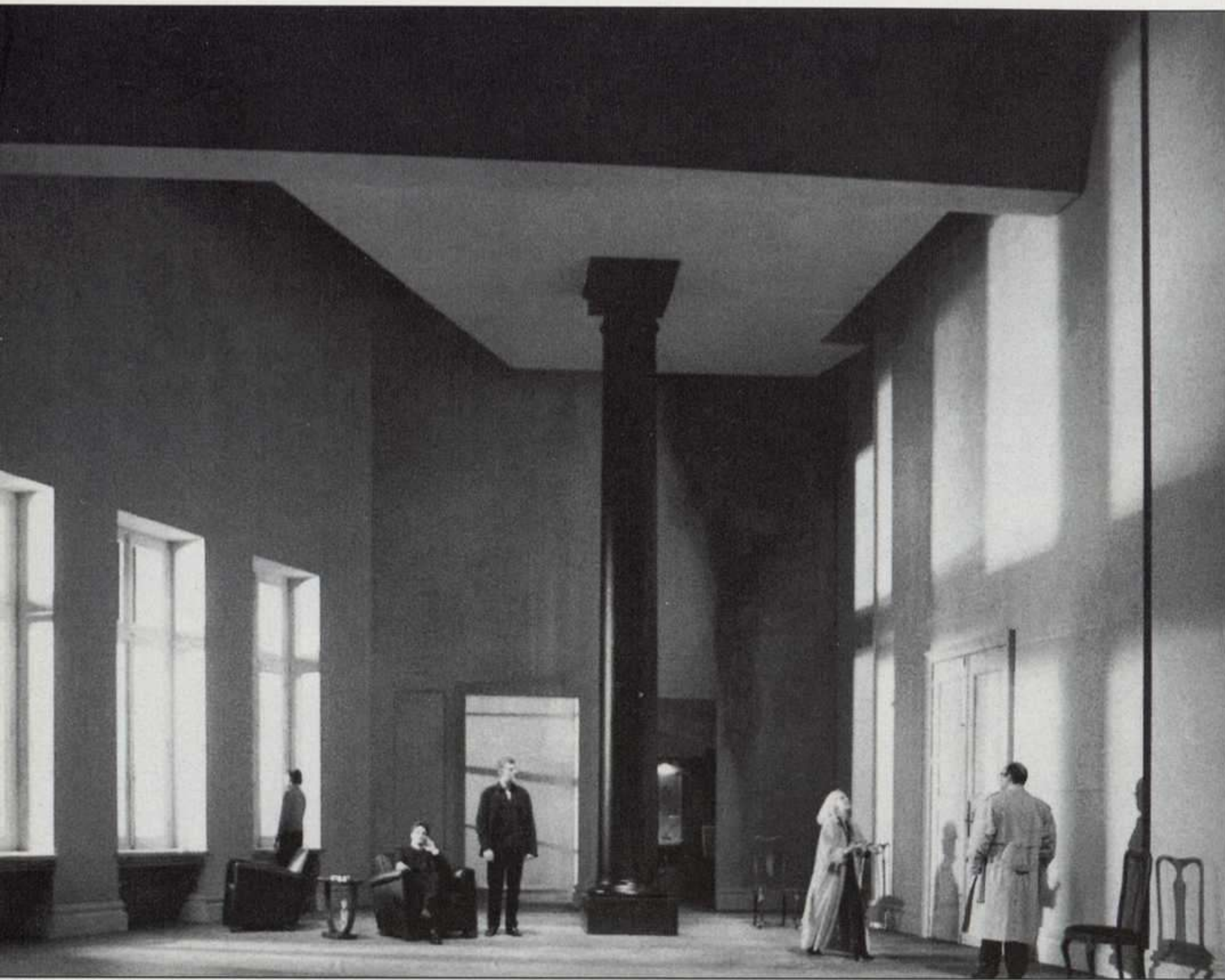
"El tiempo y la habitación", de Botho Strauss. Dirección: Lluís Homar. CDN (1996). (Foto: Ros Ribas).

espacio que crean sus palabras está tan deshabitado como una sala de espera o el umbral de una puerta.