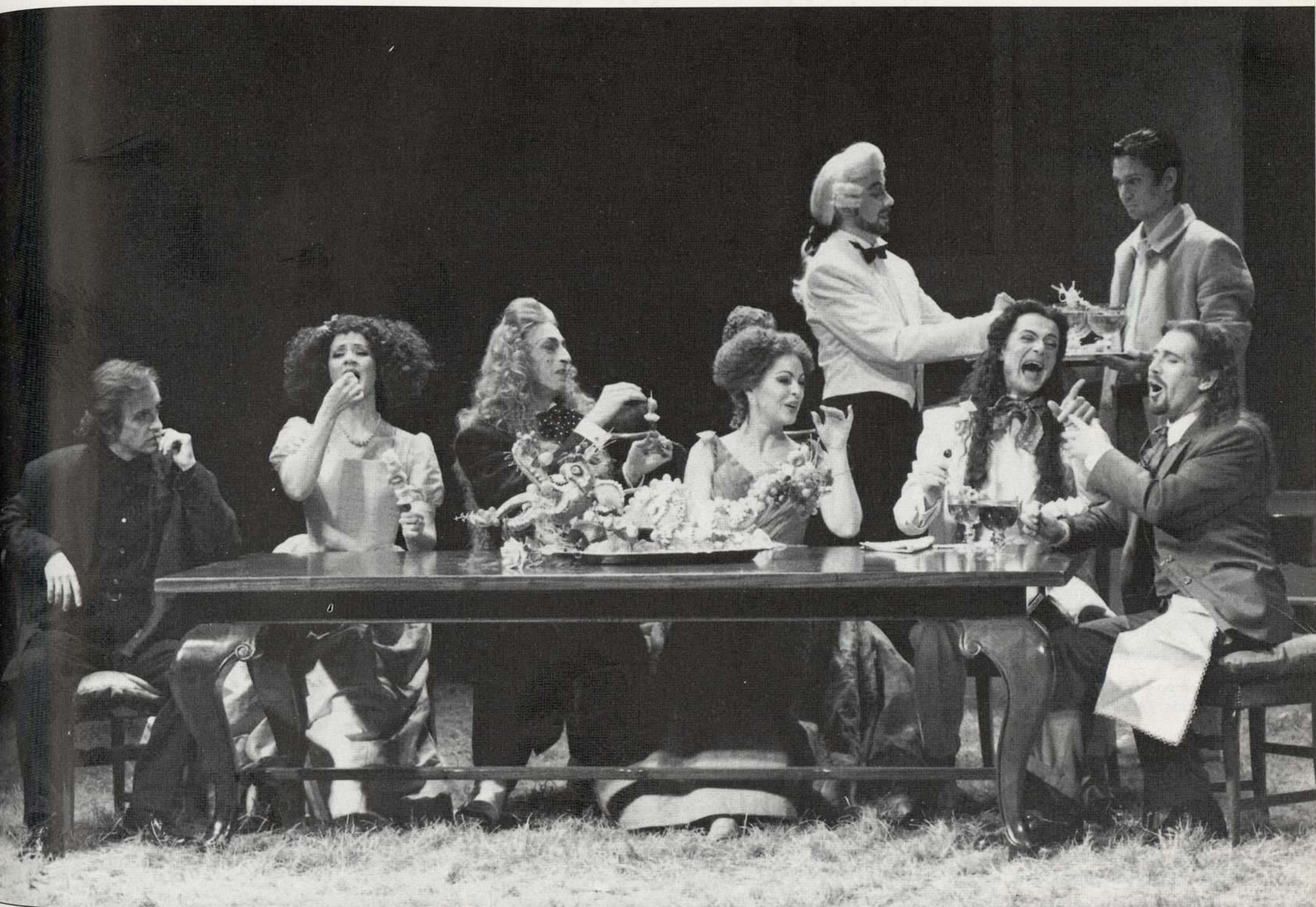
"El Misántropo", de Molière. Dirección: Adolfo Marsillach. CNTC (1996).

por, Berlusconi y, en un contexto muy diferente, Yeltsin.