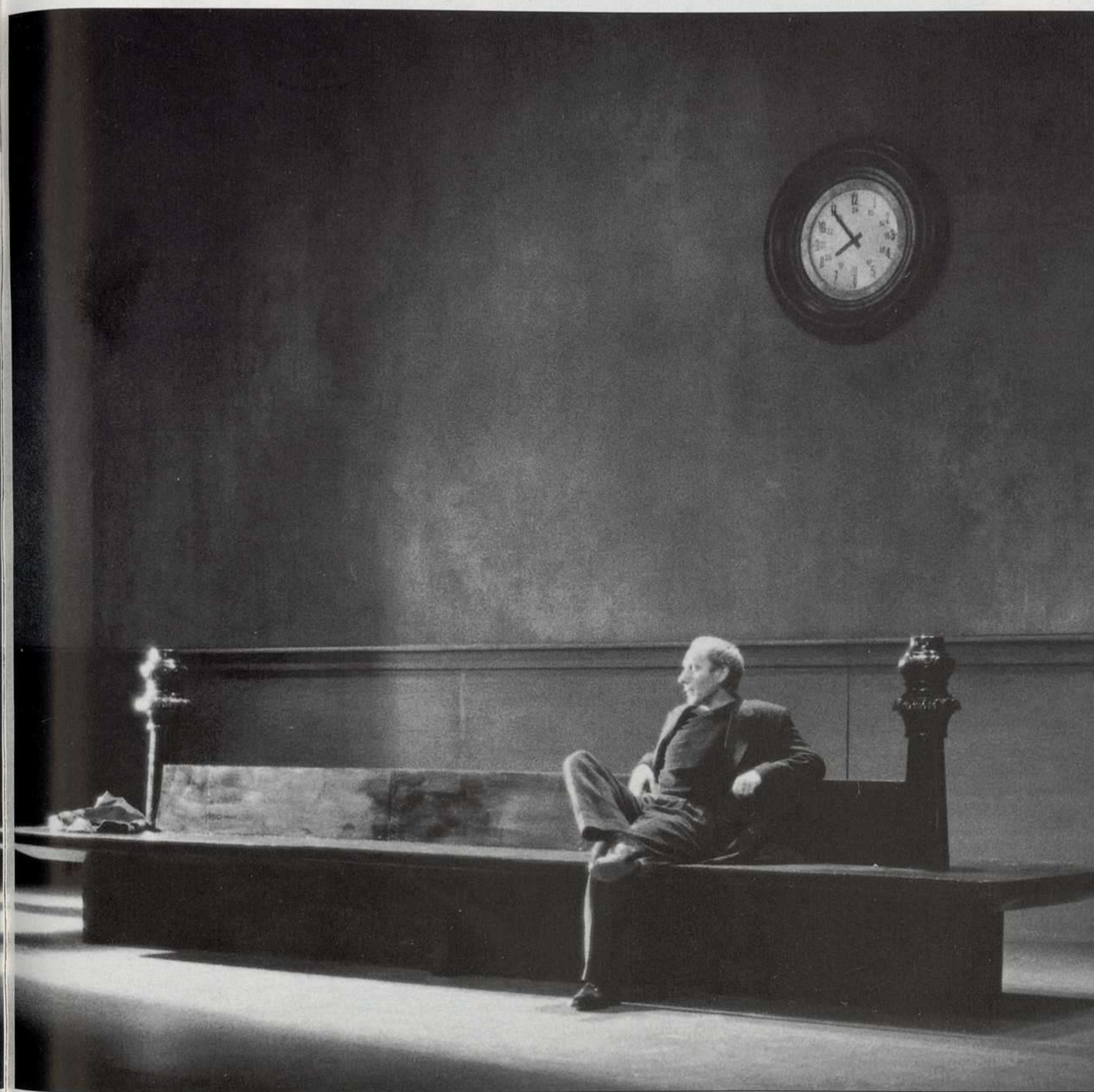
"Diálogo en re-mayor", de Javier Tomeo. Dirección: Ariel García Valdés. CDN (1996).

destrozando la agricultura y las comunidades locales, aumentando el paro, ensanchando el abismo entre ricos y pobres y destruyendo el bienestar social. Conforme este plan global avanza, exige cada vez más una despolitización mundial. De otro modo las protestas de la mayoría que padece pueden volverse demasiado insistentes. Nuestros políticos-señuelos son los agentes de esta despolitización. Y no necesariamente por decisión propia, sino por obediencia. Aceptan los proyectos del mercado global para el futuro como si fueran una ley natural en vez de examinarla como lo