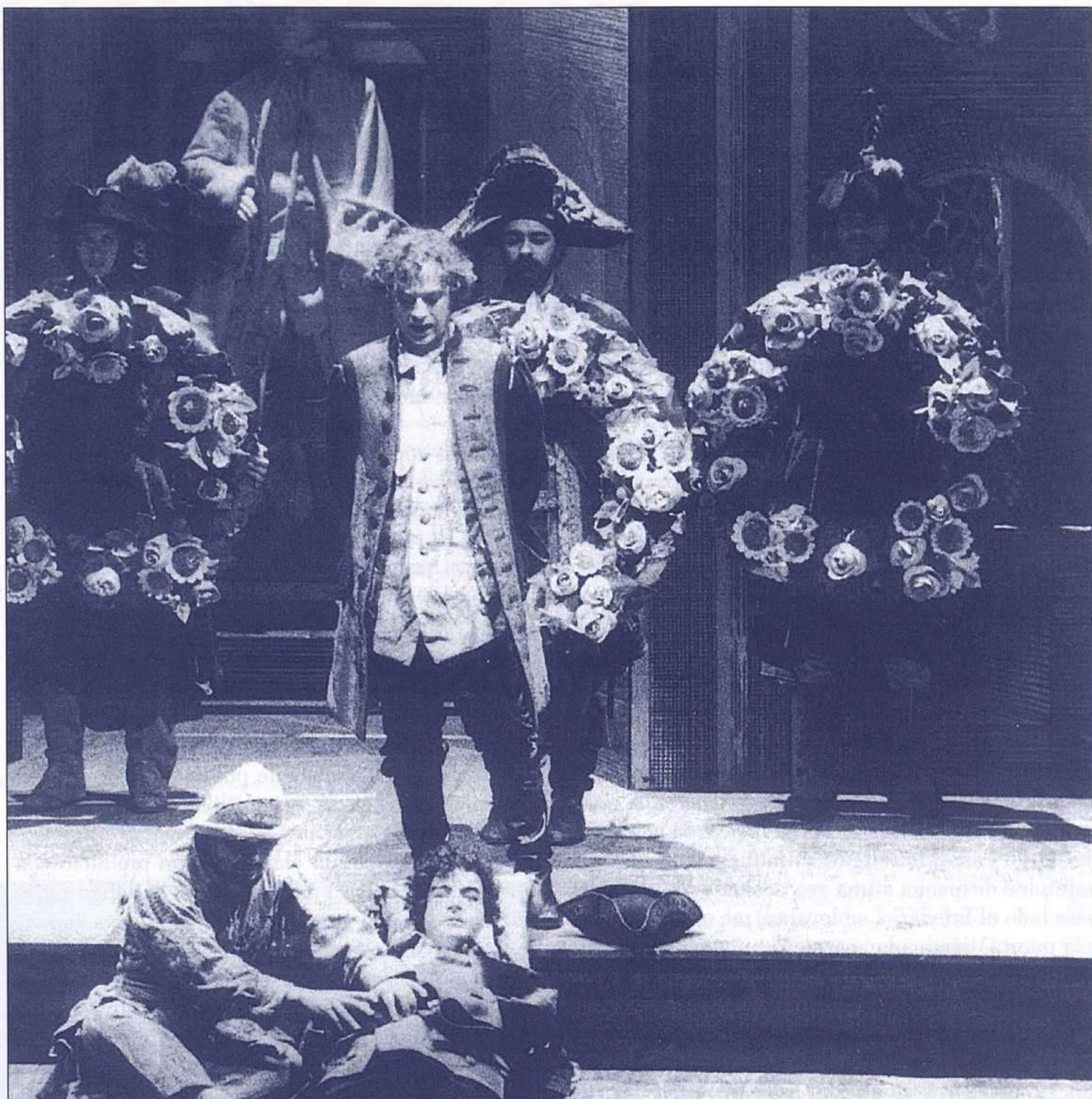
"I due gemelli veneziani". Dirección: Gianfranco de Bosio. (1991).

para embellecer las grandes festividades cortesanas más barrocas, mientras el recreo veraniego de los aristócratas, y muy pronto las temporadas de teatro cantado de la burguesía ilustrada, se pobló de textos cómicos.