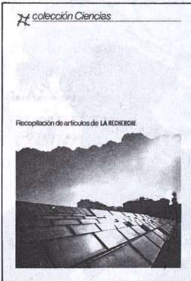
coleccion Ciencias Recopilación de artículos de LA RECHERCHE LAS NUEVAS ENERGÍAS

La crisis ha llevado a un desarrollo masivo de las investigaciones sobre las fuentes y los medios de producción de energías cada vez más diversas. Los conocimientos y proyectos actuales de la investigación sobre las nuevas energías.