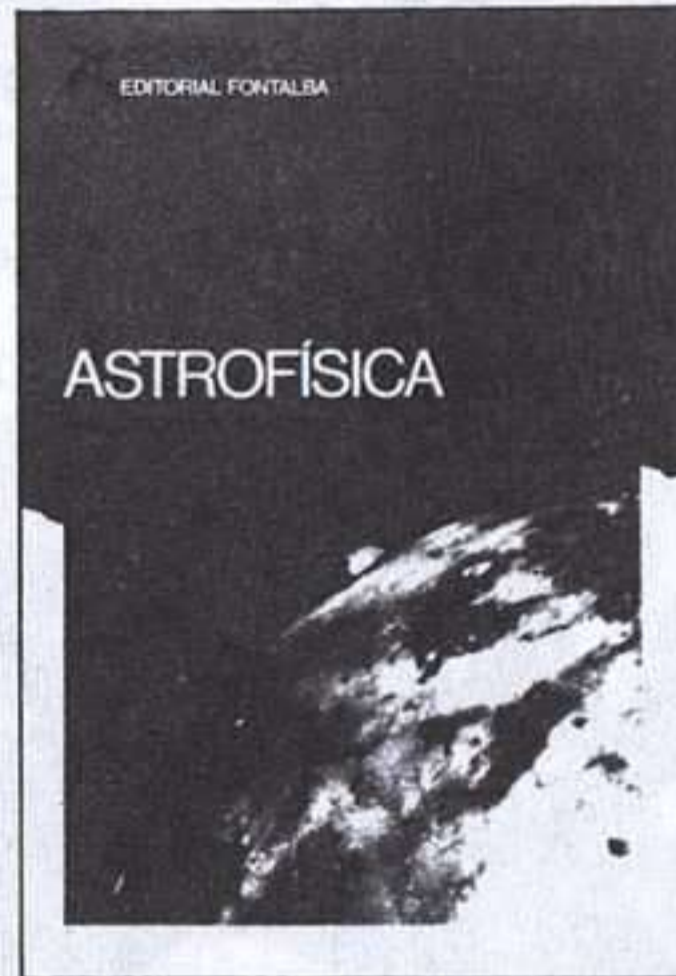
EDITORIAL FONTALBA ASTROFÍSICA

Formato: 21 x 14,5 cm - Páginas: 264 - Fotografías e ilustraciones. P.V.P.: 950 ptas.