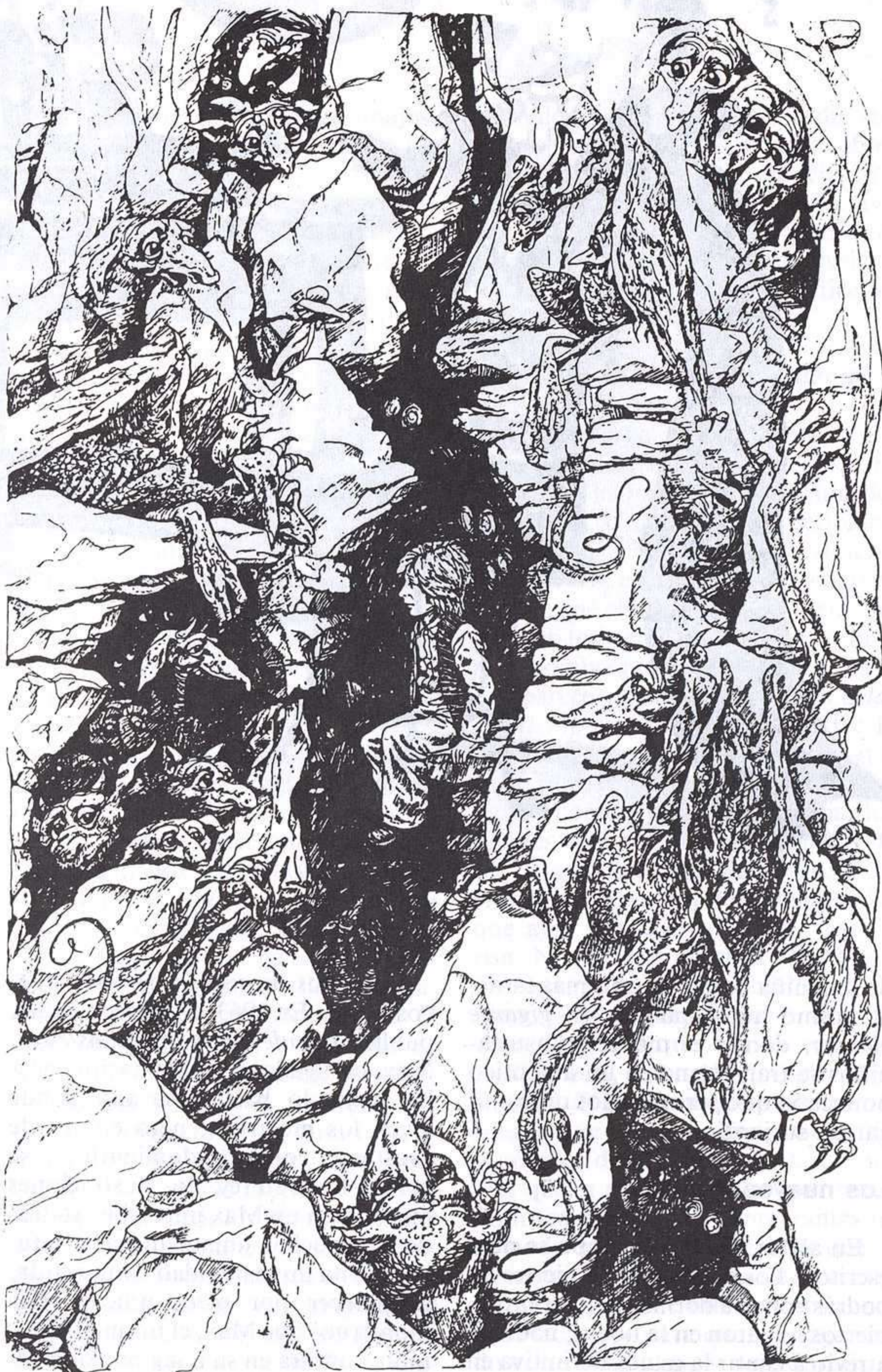
BRIAN FROUD. Ed. ALFAGUARA

Los personajes y miedos tradicionales se enmarcan dentro de una cultura agrícola, asociados a una religión y a supersticiones primitivas. Tal vez la literatura infantil y juvenil tiene planteado un nuevo reto en la búsqueda de significantes, o tal vez ya los ha encontrado con la literatura realista y sus temas de drogas, soledad, suicidio, o través de la ciencia-ficción. Las cosas han cambiado y, por ello, una manera de tener miedo nos la hemos dejado en el camino. O quizás, monstruos, fantasmas y vampiros duermen entre candilejas, esperando que la his-