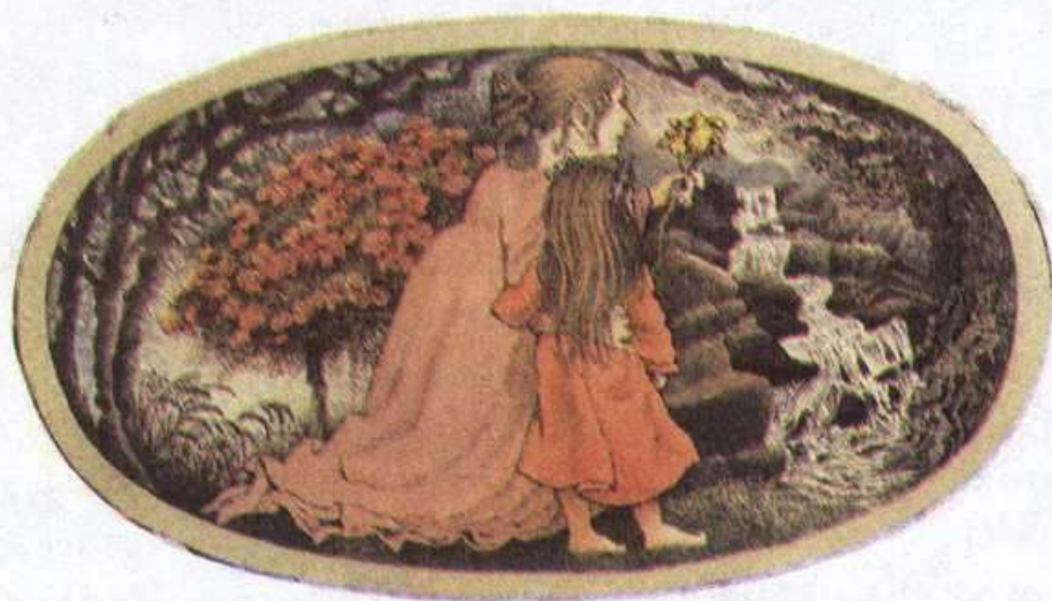
FARRAR, STRAUS & GIROUX. «DEAR MILI». MICHAEL DI CAPUA BOOKS, 1989.

y que ahora andan preparando novedades en el terreno de este polémico pero conveniente matrimonio entre imagen y libro.