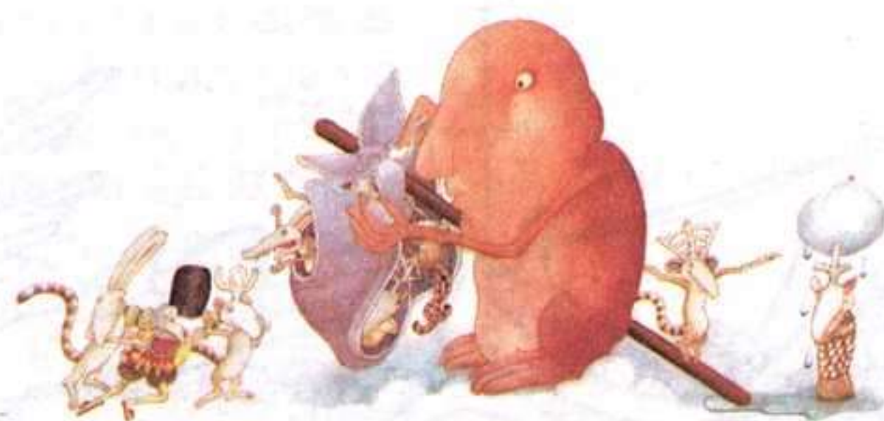
FARRAR, STRAUS & GIROUS. «A LONG-LONG SONG». MICHAEL DI CAPUA BOOKS, 1989.

al libro documental e informativo; fuerte presencia del libro-objeto con troquelados, tres dimensiones, sonido incorporado y un acompañamiento de los más variados gadgets : reproducciones de personajes en plástico, felpa o peluches varios, postales, pósters,