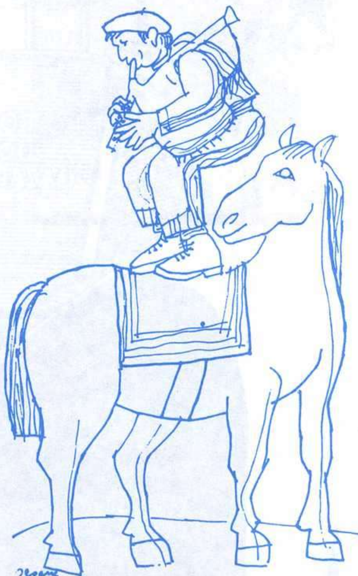
SEOANE. CARTAS A LELO. DO CASTRO.

Más allá del influjo cunqueirano, hay también escritores que cultivan el género fantástico en una línea más convergente con la que es habitual en