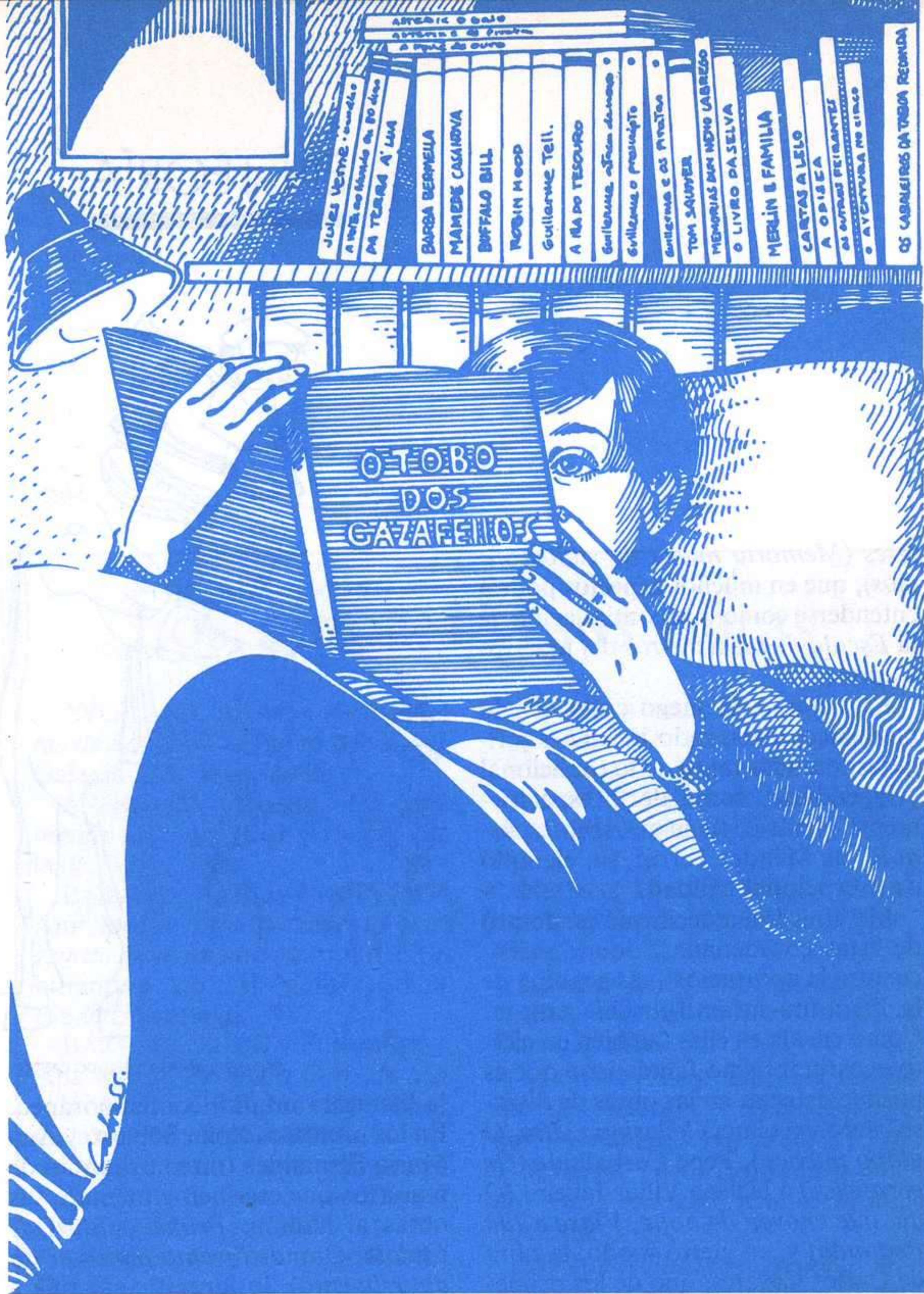
CABRAS. OS GAZAFELLOS. GALAXIA.

pero sin duda es, en la actualidad, el autor con más clara influencia sobre quienes escriben literatura infantil en gallego.