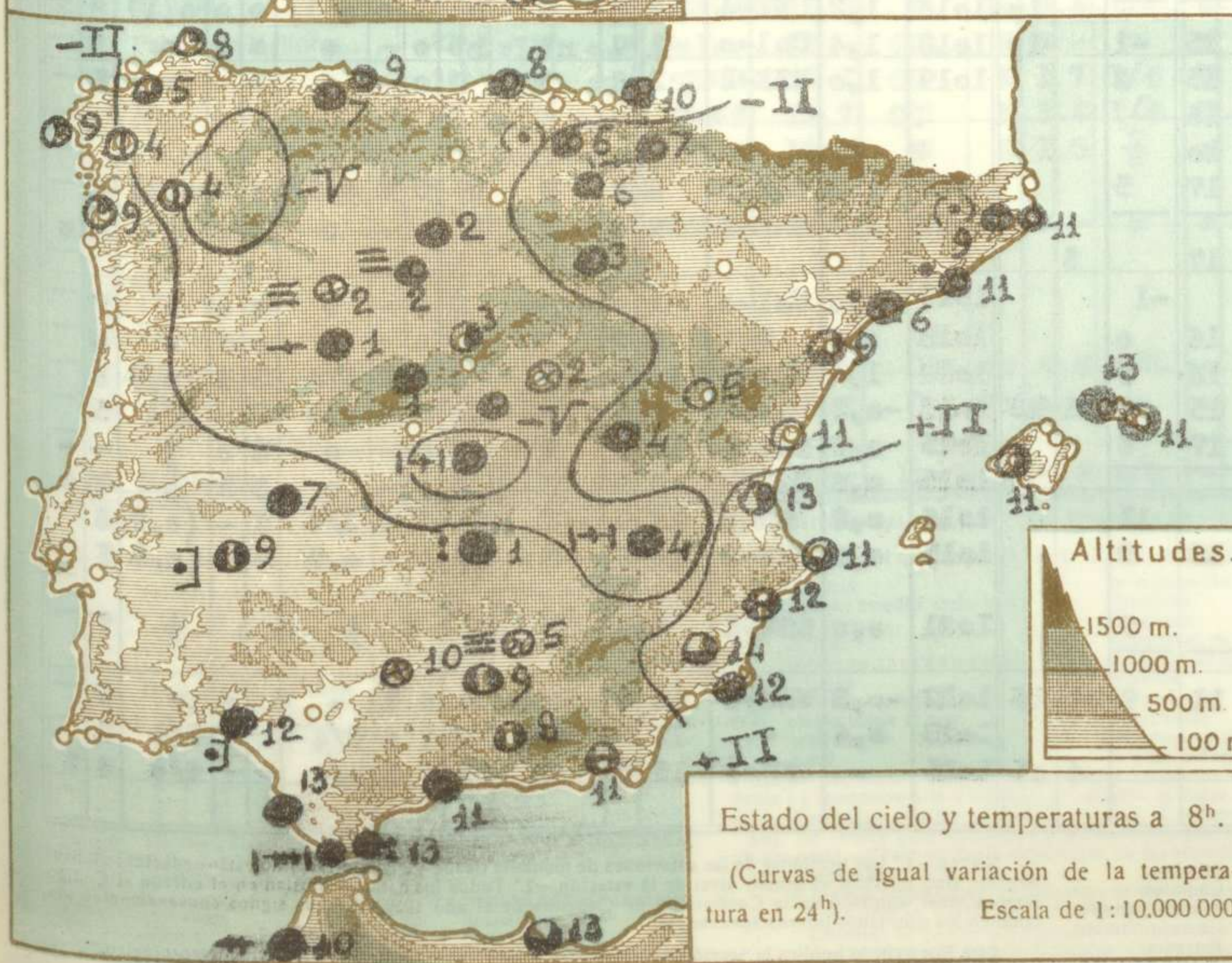
Estado del cielo y temperaturas a 8 h .

(Curvas de igual variación de la temperatura en 24 h ). Escala de 1:10.000.000.