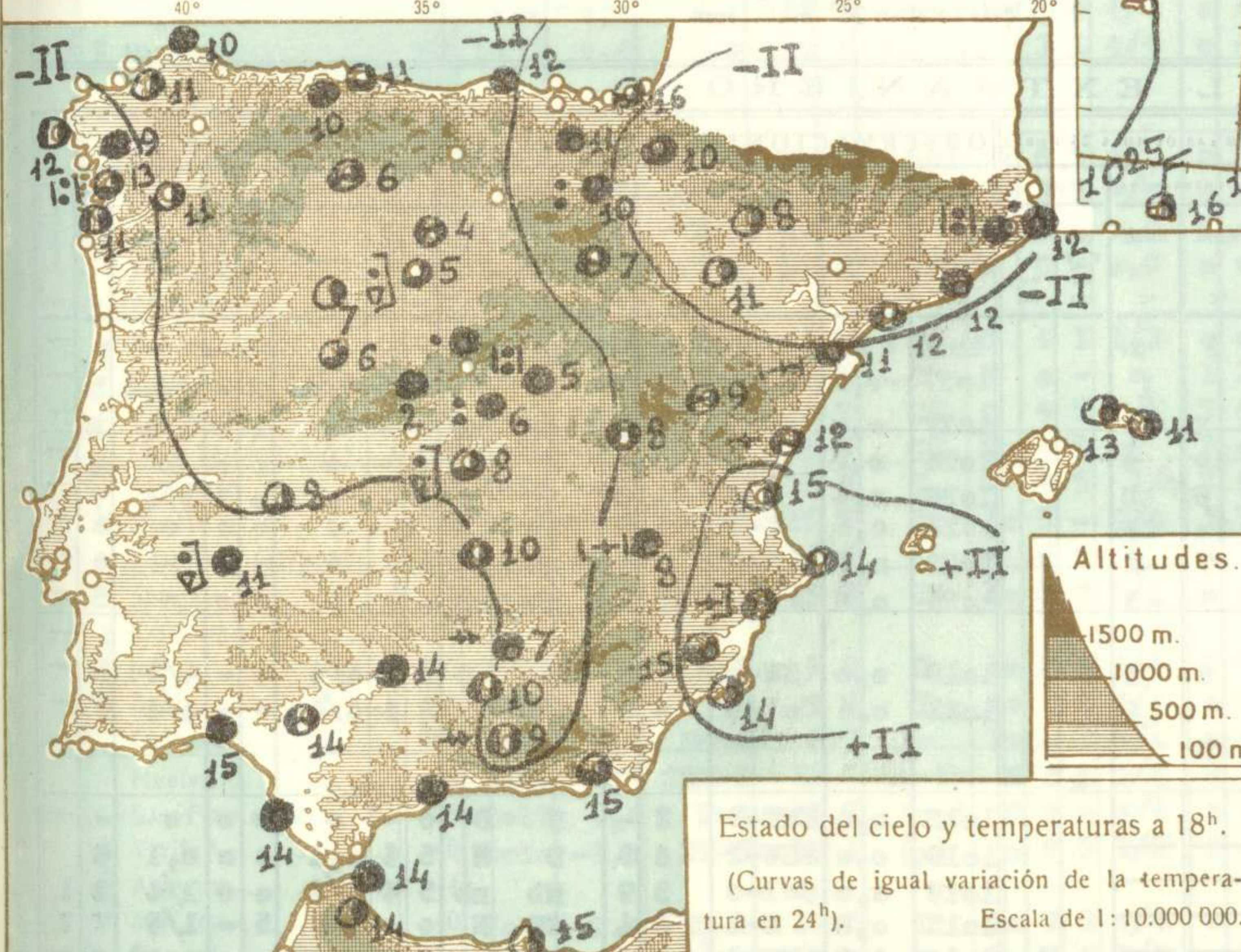
Estado del cielo y temperaturas a 18 h .

(Curvas de igual variación de la temperatura en 24 h ). Escala de 1:10.000.000.