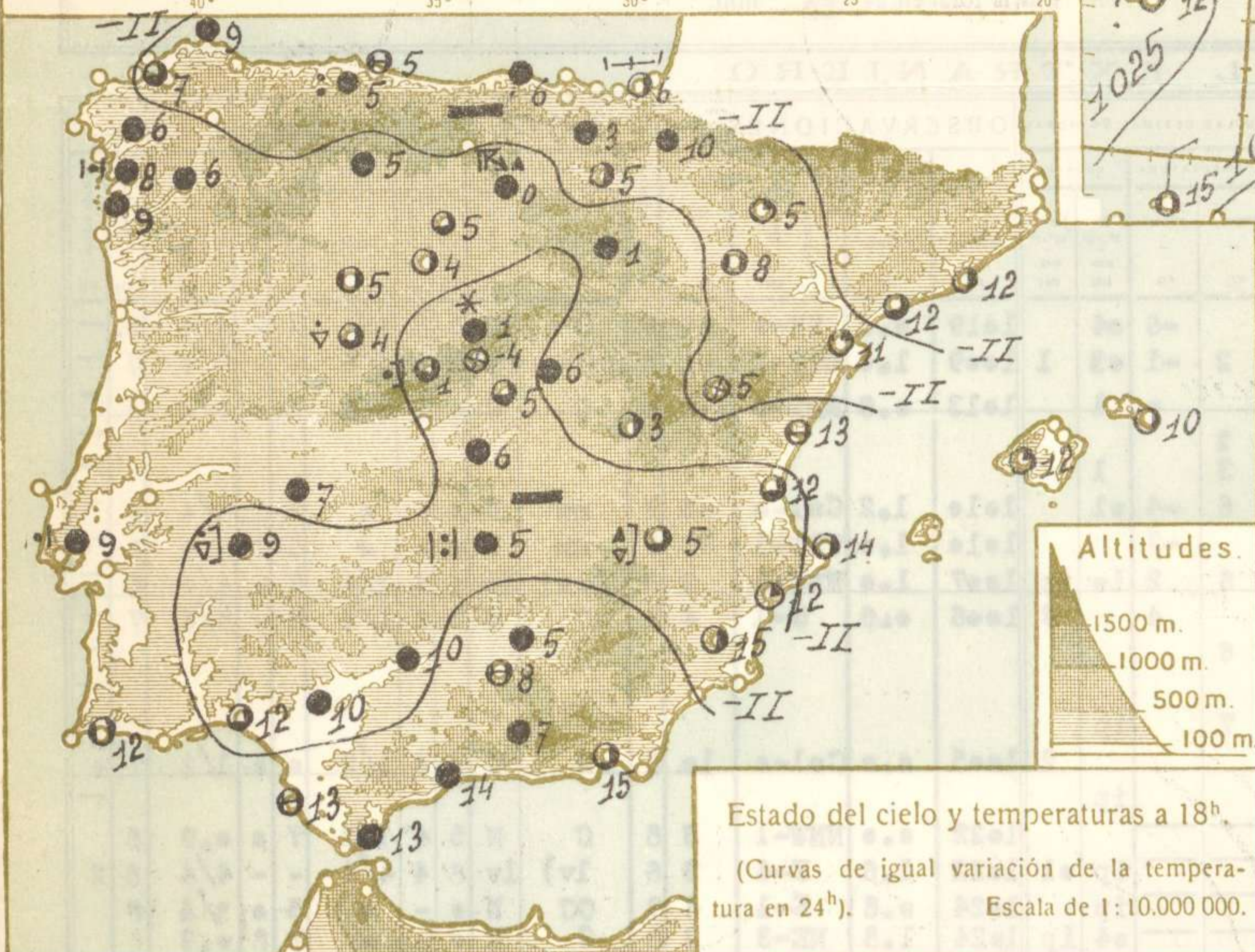
Estado del cielo y temperaturas a 18 h . (Curvas de igual variación de la temperatura en 24 h ). Escala de 1:10.000.000.