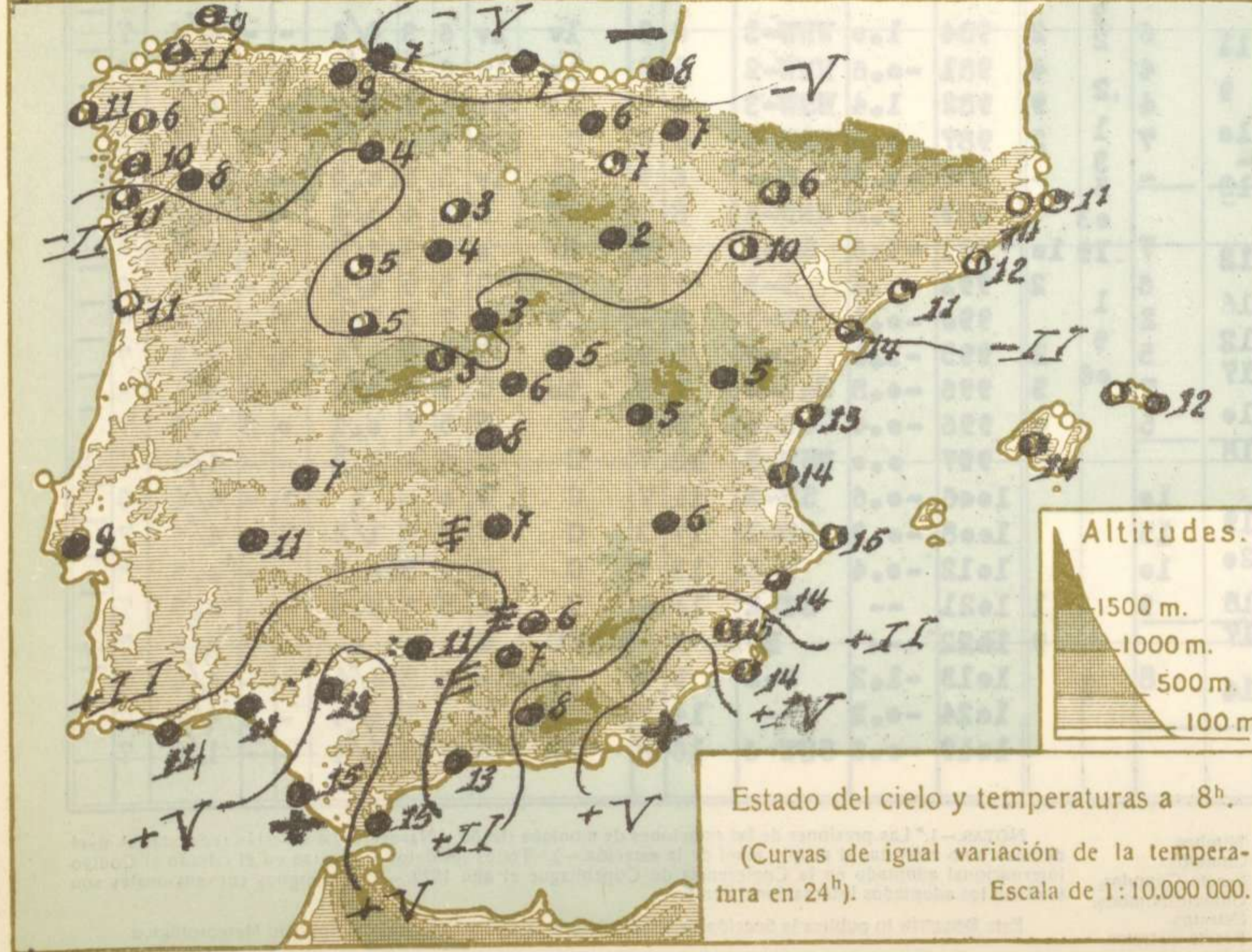
Estado del cielo y temperaturas a 8 h . (Curvas de igual variación de la temperatura en 24 h ). Escala de 1:10.000.000.