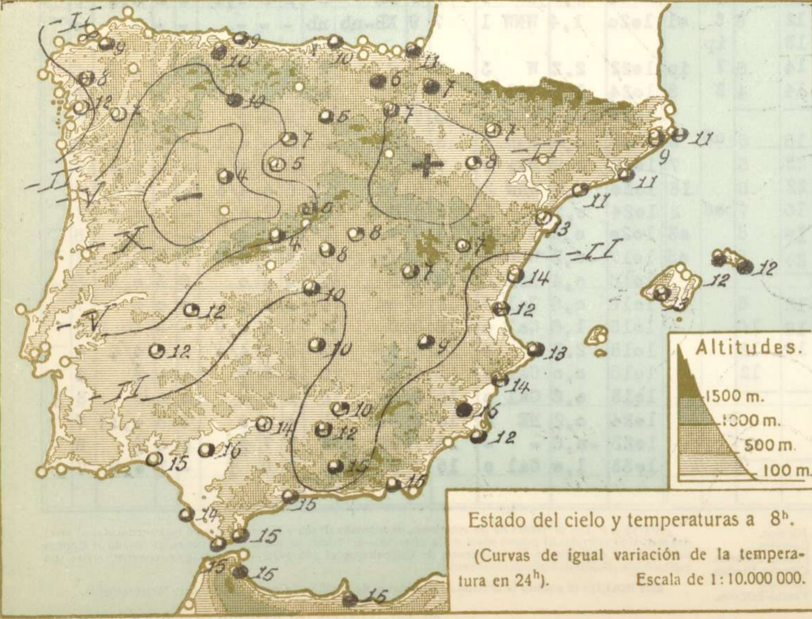
Estado del cielo y temperaturas a 8 h . (Curvas de igual variación de la temperatura en 24 h ). Escala de 1:10.000.000.