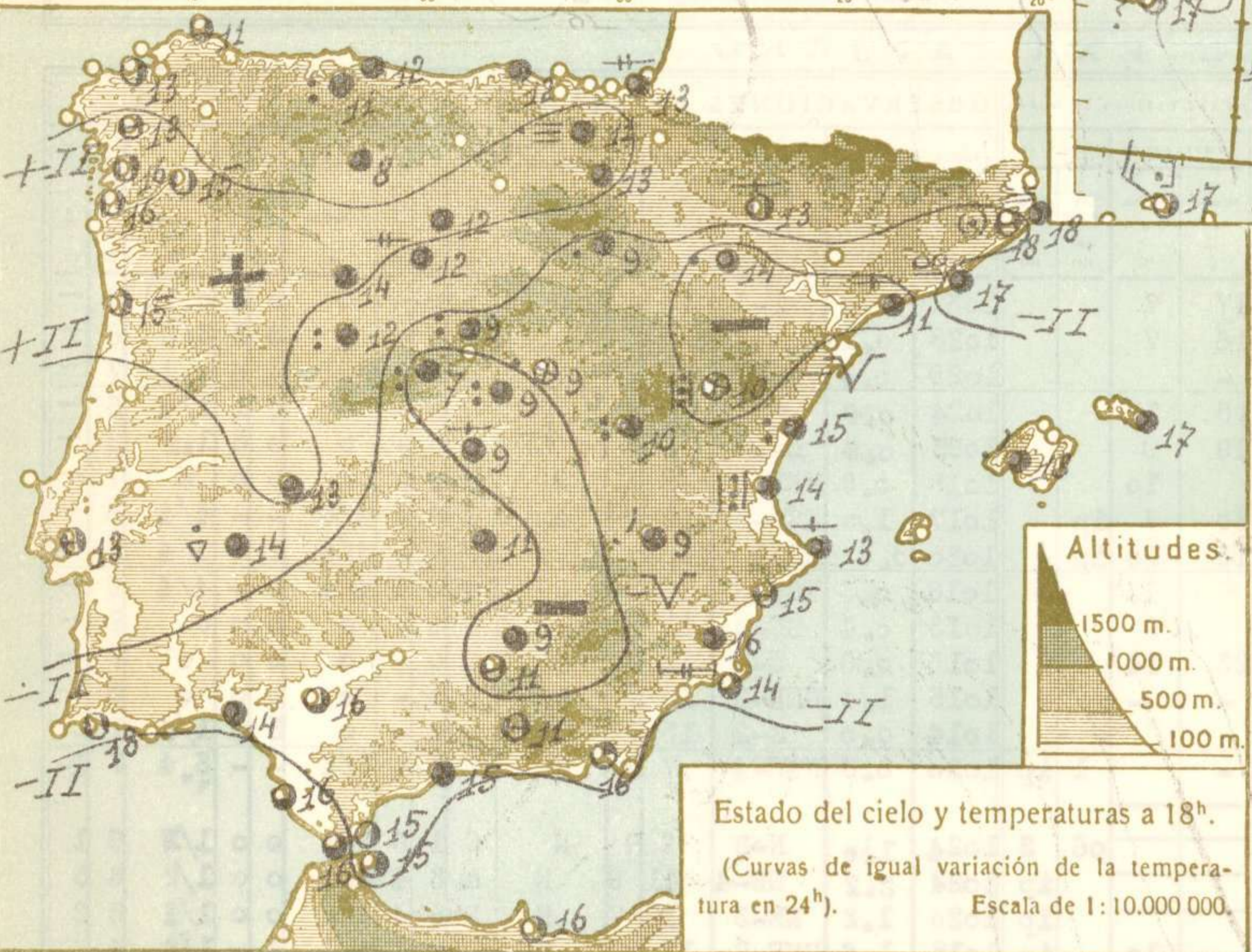
Estado del cielo y temperaturas a 18 h . (Curvas de igual variación de la temperatura en 24 h ). Escala de 1: 10.000.000.