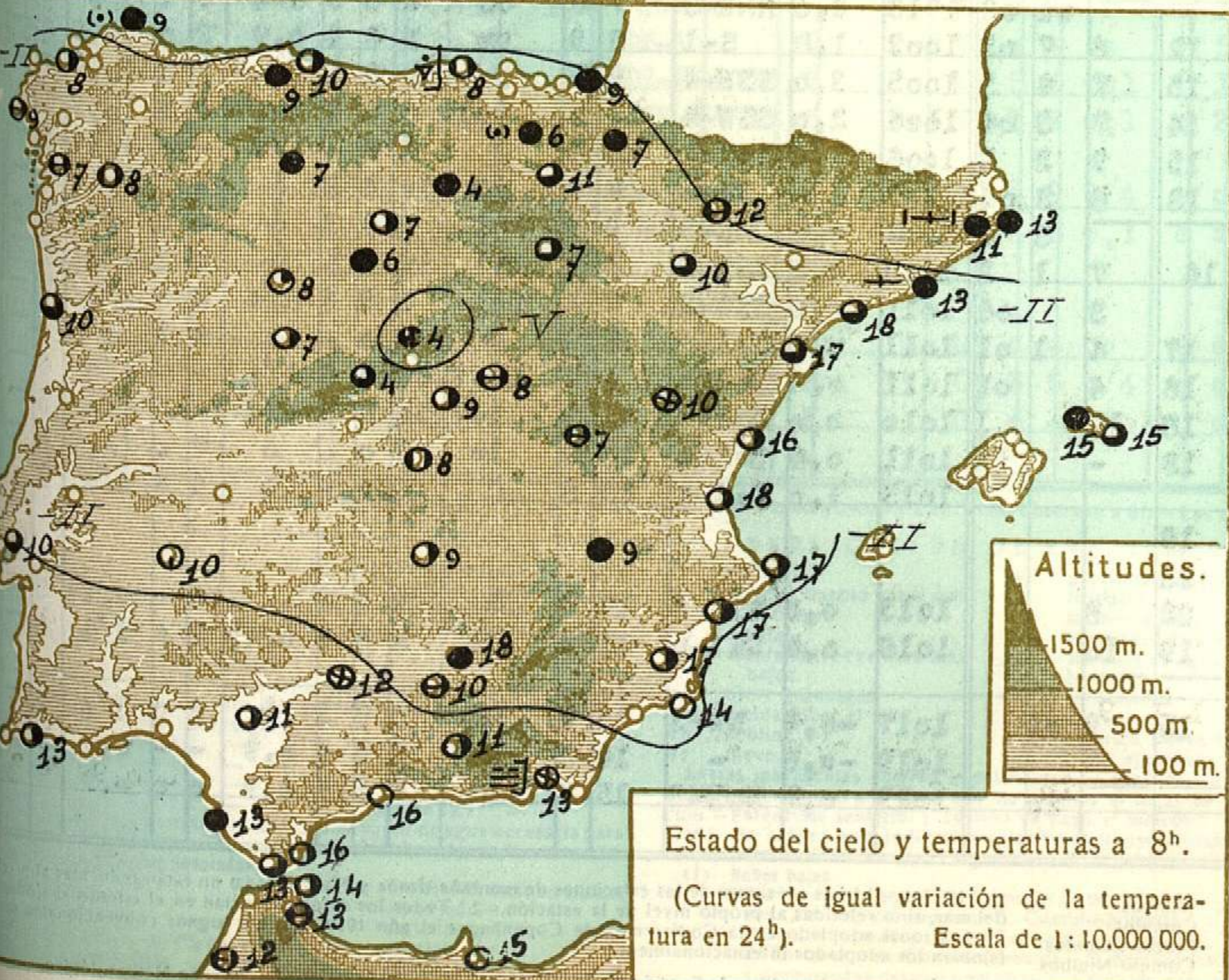
Estado del cielo y temperaturas a 8 h . (Curvas de igual variación de la temperatura en 24 h ). Escala de 1:10.000.000.