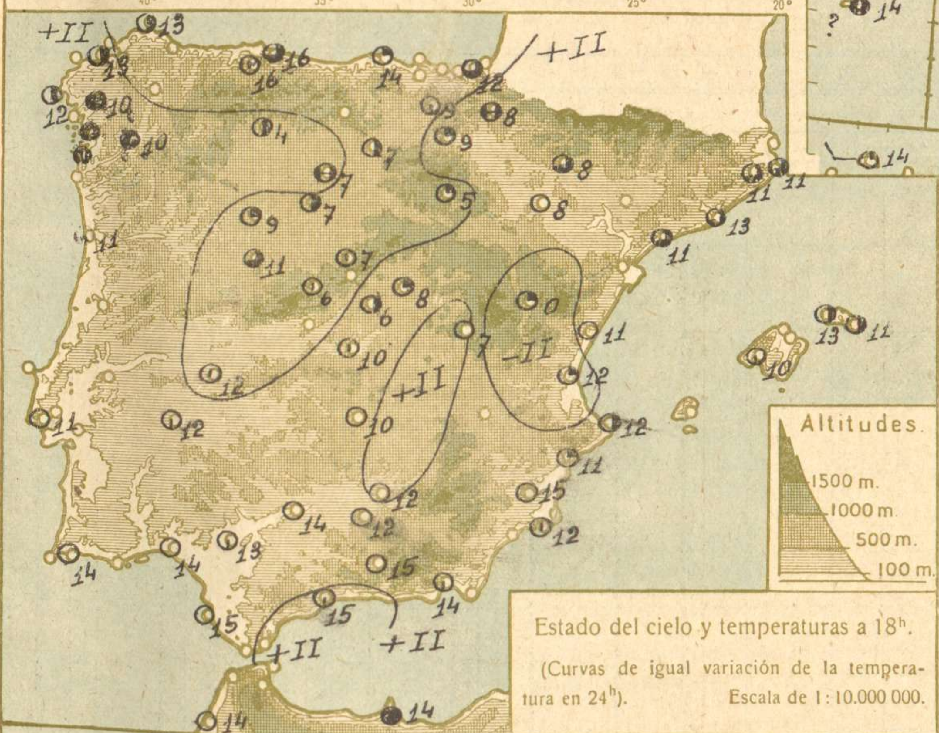
Estado del cielo y temperaturas a 18 h . (Curvas de igual variación de la temperatura en 24 h ). Escala de 1:10.000.000.