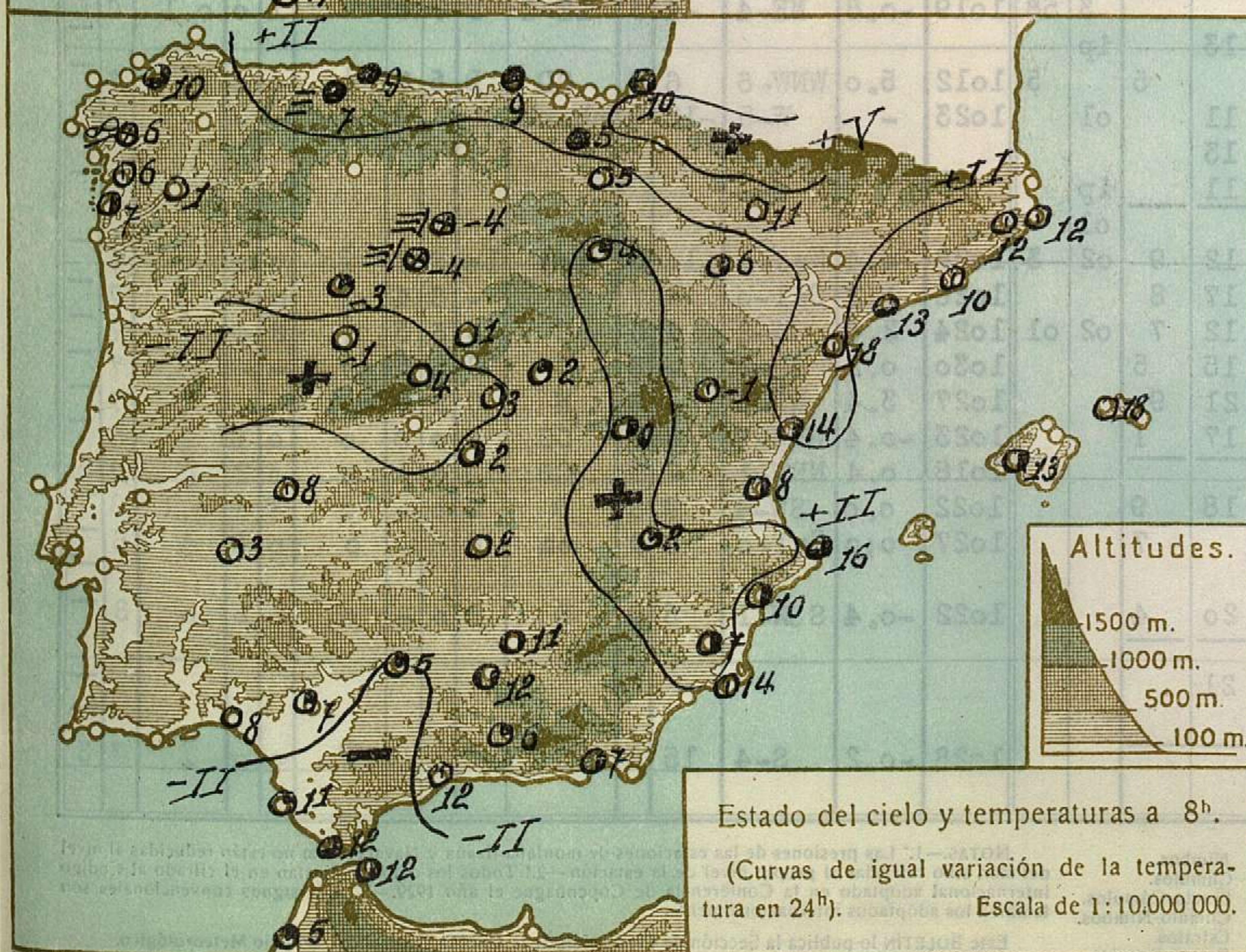
Estado del cielo y temperaturas a 8 h . (Curvas de igual variación de la temperatura en 24 h ). Escala de 1:10.000.000.