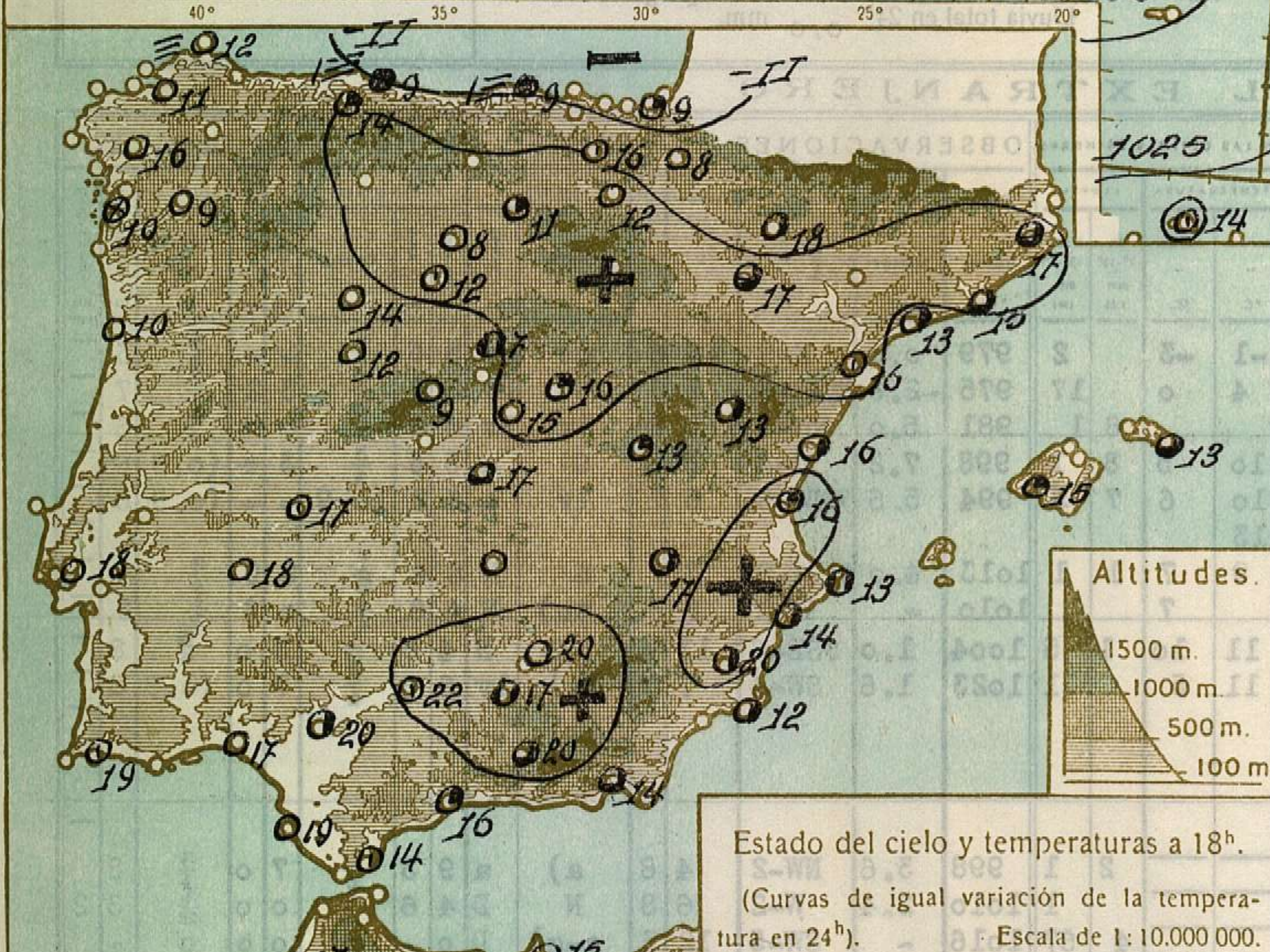
Estado del cielo y temperaturas a 18 h . (Curvas de igual variación de la temperatura en 24 h ). Escala de 1:10.000.000.