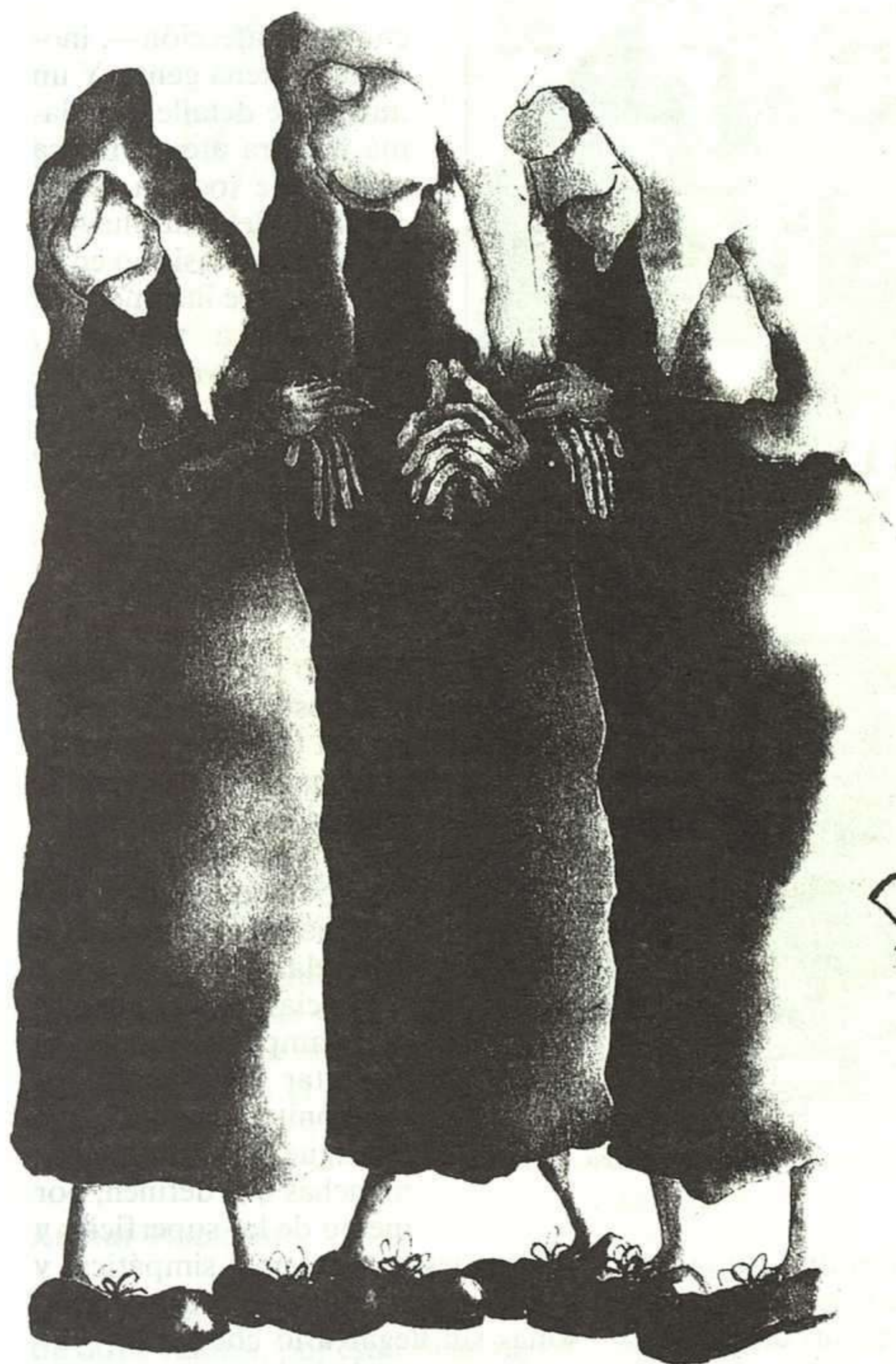
6 N. LÓPEZ, LAS TRES TONTAS. LA POESÍA NO ES UN CUENTO, MADRID: BRUÑO, 1990.