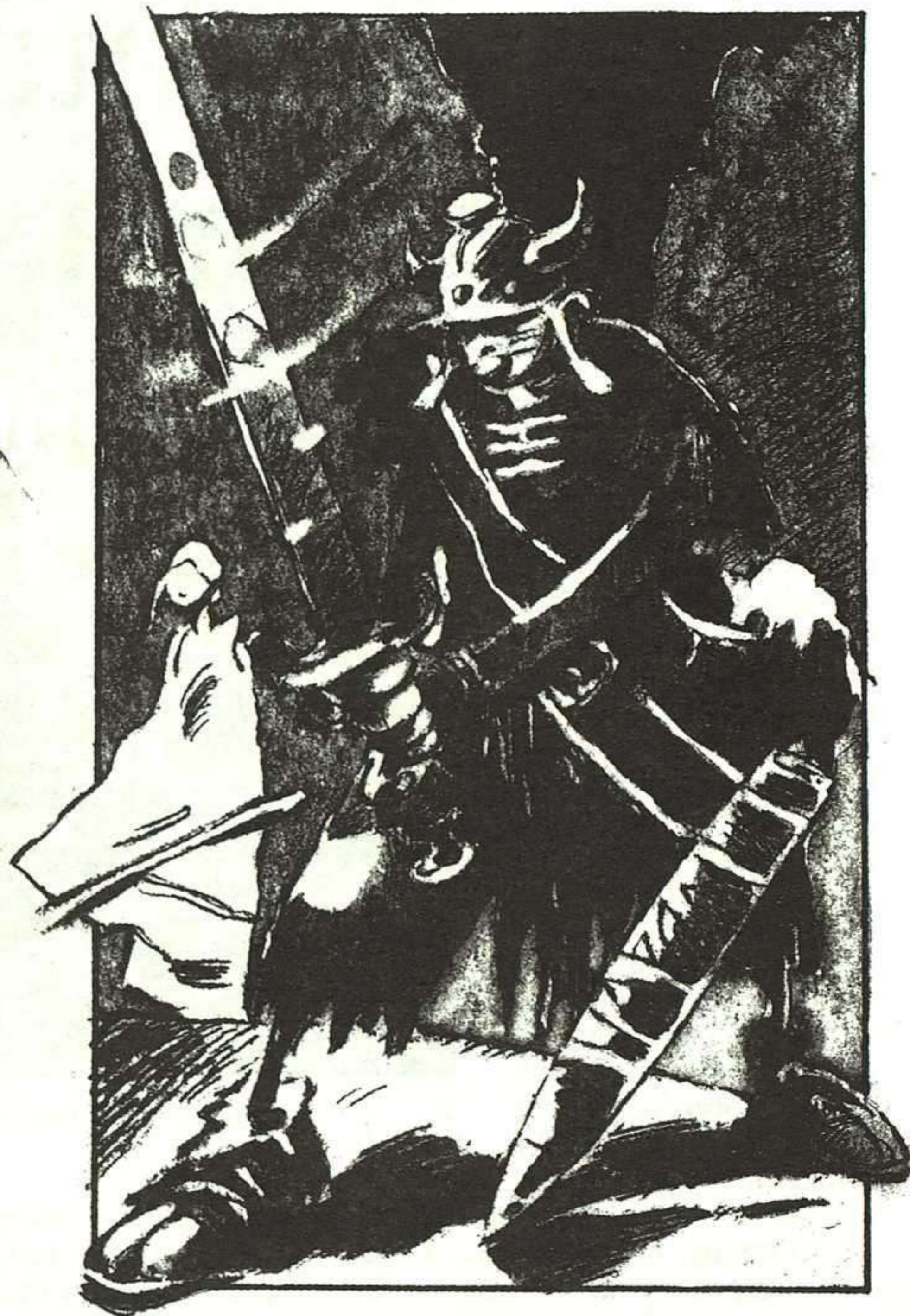
7 T. GATAGÁN, LA ESPADA DE LIUVA, MADRID: SM, 1990.

rada técnica con la que extraer gran cantidad de calidades, matices y texturas, superponiendo a las manchas de las aguadas, las del lápiz, con sus líneas sueltas, de factura rápida y desmenuada.