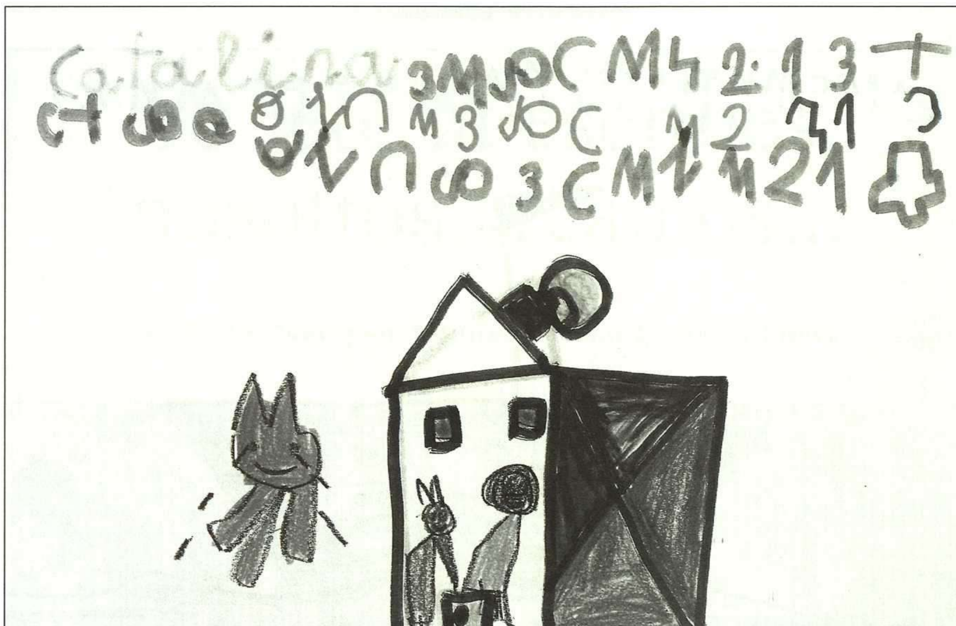
«El gato llorón», historia creada por Catalina, de 4 años y 3 meses.

ración positiva del libro objeto, al que es necesario cuidar.