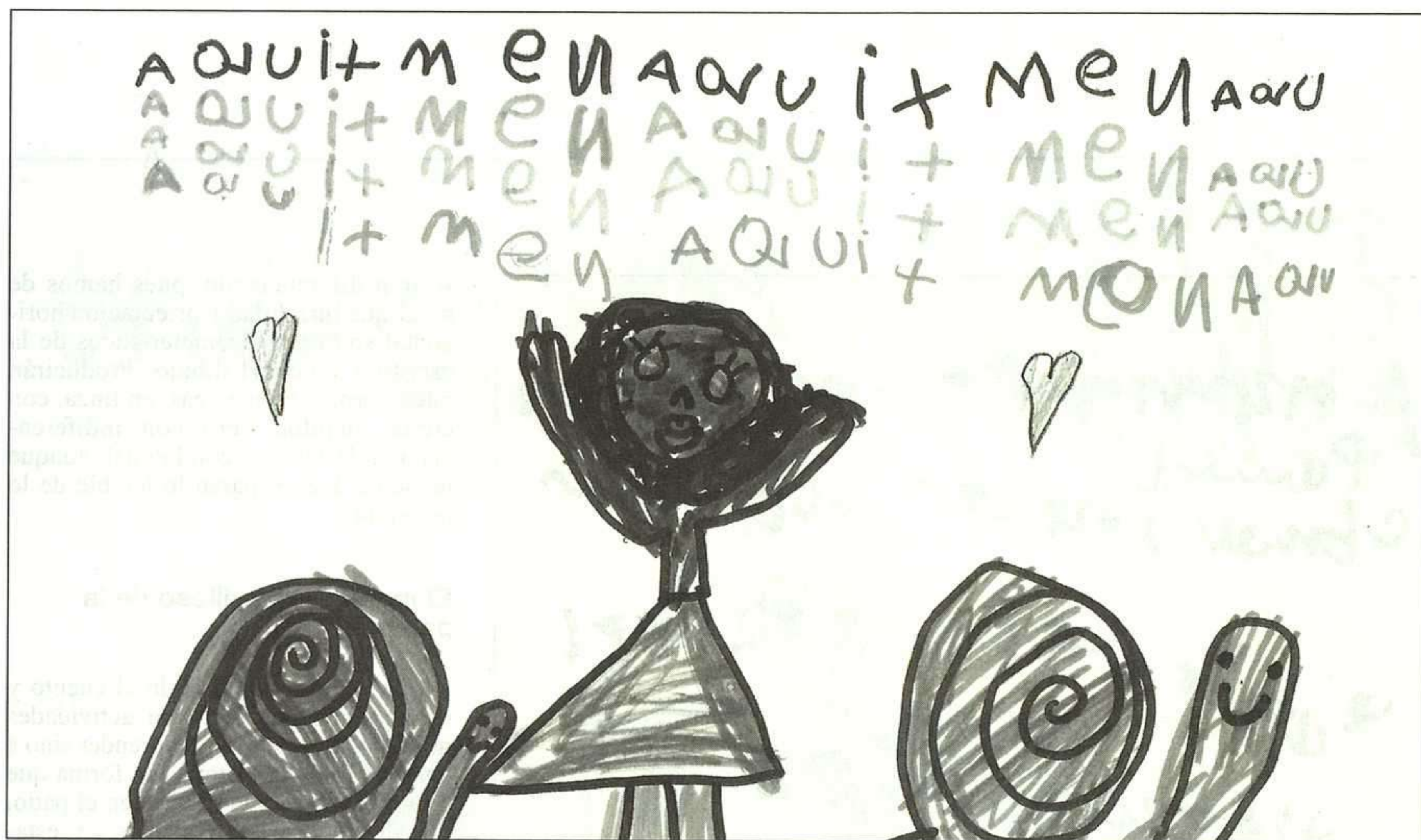
Retahila: «Caracol, col, col». Obsérvese la repetición de las grafías.

los. Respetan el movimiento de izquierda a derecha y de arriba hacia abajo, con una serie de elementos gráficos que, en su mayoría, no se corresponden con el código adulto, combinados con los números y vocales que conocen de éste. Aunque para nosotros es prácticamente imposible descifrarlos, ellas no tienen ningún problema para hacerlo; se trata de su propio código, un código tan personal como ellas mismas, con el que son capaces de comunicarse con las demás al leerlo; un código con su lógica particular, ya que repiten minuciosamente signos en momentos determinados que responden a una intencionalidad definida; por ejemplo, cuando escriben los estribillos de cualquier canción o las repeticiones propias de la poesía popular.