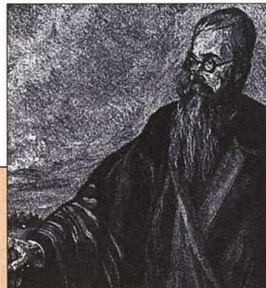
Retrato de Valle-Inclán realizado por Juan Echevarría.

Con anterioridad he pergeñado una lectura posible de algunas obras del Noventayocho, una lectura que se me antoja ahora demasiado romántica. No obstante, hay quien dice que nuestro fin de siglo es también romántico. ¿O los románticos éramos nosotros y no los jóvenes de ahora? ¿No habré hecho más proyección que prospección? En fin, mejor dejarlo en interrogante (¿cabrá una lectura ecológica de Azorín?, ¿el ensueño, hoy, en nuestra naturaleza degradada, de un infinito real será uno de