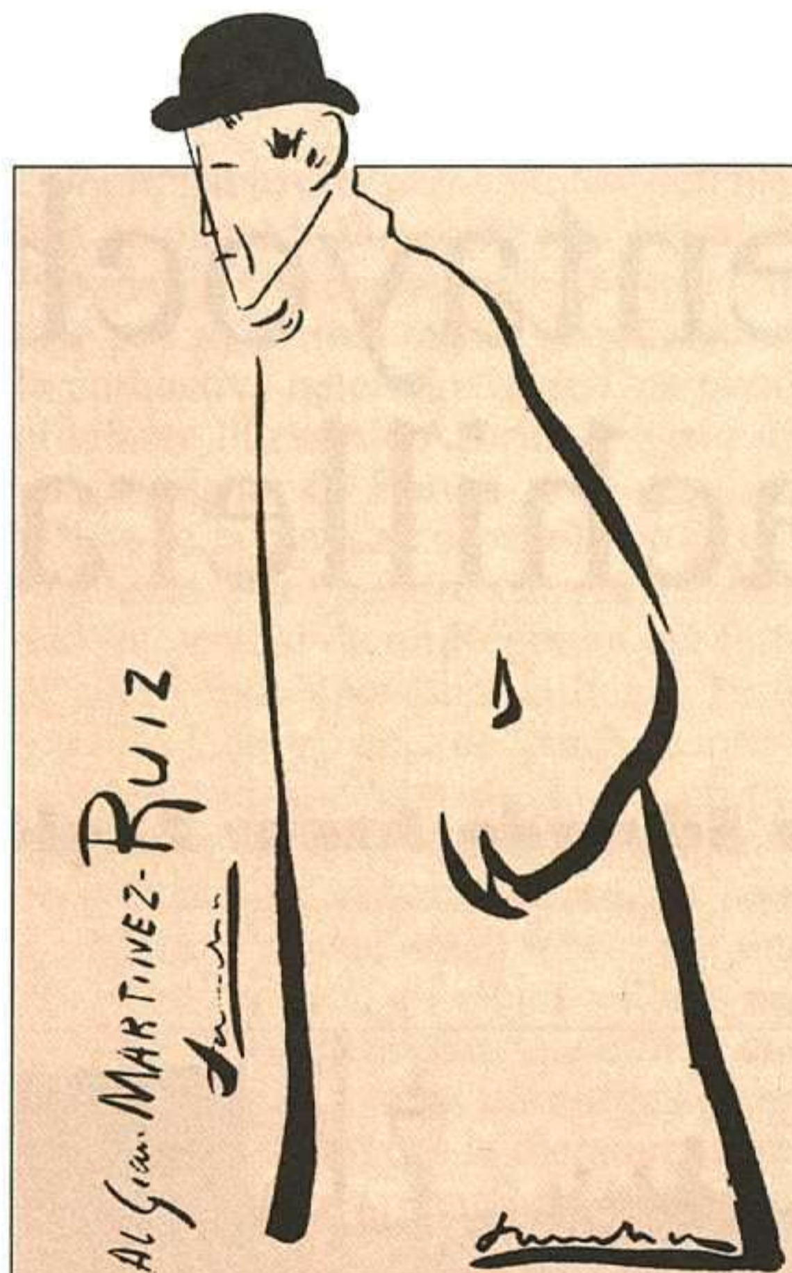
Caricatura de Azorín firmada por Sancha.

Aplacemos lo primero. En cuanto a lo segundo, a las expectativas, es decir a lo que podrá quedar e interesar del Noventayocho a nuestros jóvenes estudiantes en el futuro inmediato, sin duda, tendrá que ver con las respuestas que los autores de aquella consagrada generación puedan aportar a las nuevas preguntas que serán formuladas en el presente. Cuáles sean esas preguntas, yo no me atrevo a precisarlo. Es verdad que ciertas proyecciones y alguna intuición se me ocurren al respecto; pero procedamos