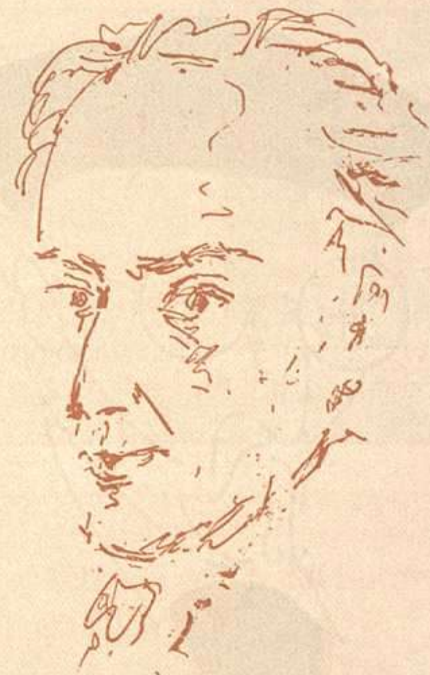
Dibujo de Machado, realizado por Picasso.

Antonio Machado (Sevilla, 1875-Colliure, Francia, 1939)