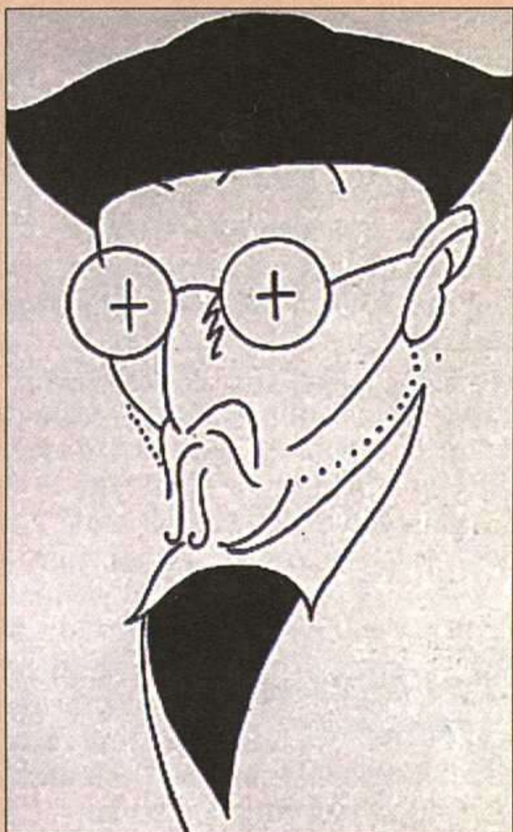
Caricatura de Miguel de Unamuno.