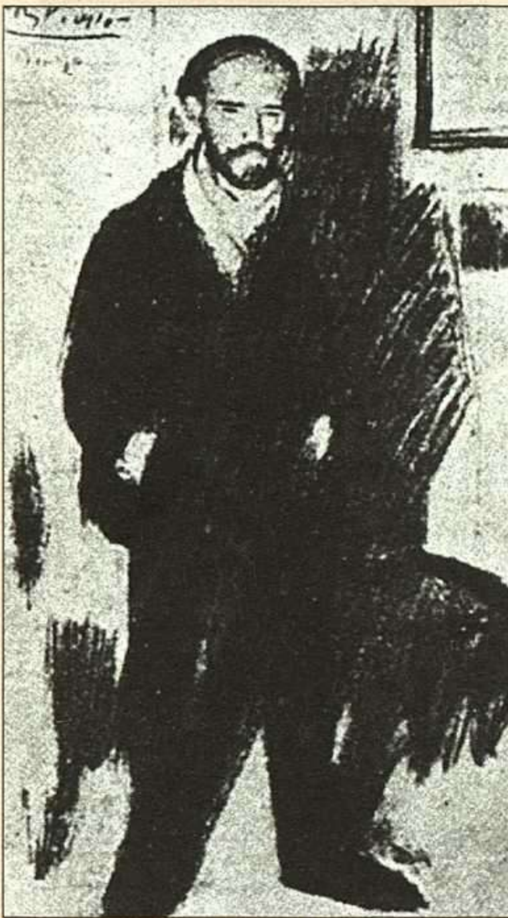
Pío Baroja fue retratado por el genio de Picasso.