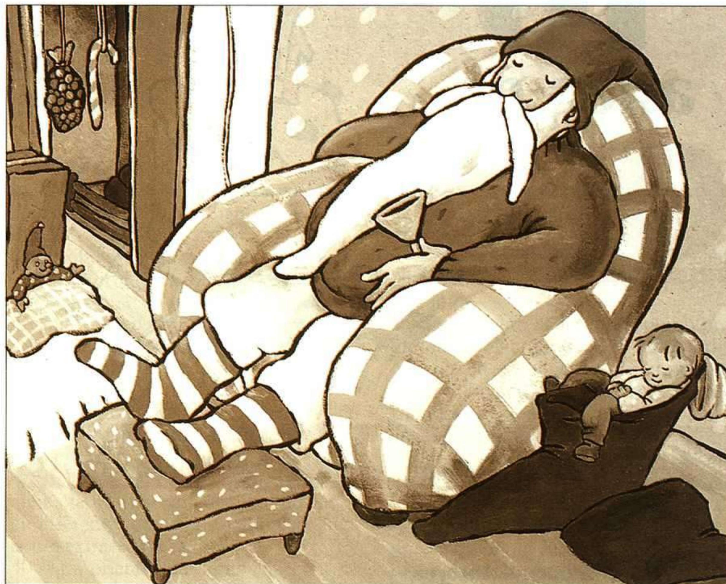
JEANNE ASHBÉ, DEAR FATHER CHRISTMAS, PASTEL/LECOLE DES LOISIRS, 1979.

La universidad, entre sus funciones, tiene la de dar respuesta a las demandas educativas y culturales de la sociedad; hoy, la literatura y, en general, todos los estudios humanísticos están infravalorados, tanto educativa, como institucional y socialmente. La realidad actual de la literatura infantil, con más de cuatro mil títulos editados cada año, con una población lectora importante y con bastantes buenas colecciones, no tiene la valoración social e institucional que debiera tener, ni tampoco la correspondencia que debiera ser necesaria en el proceso formativo de los futuros docentes, ni de Educación Primaria ni de Educación Secundaria.