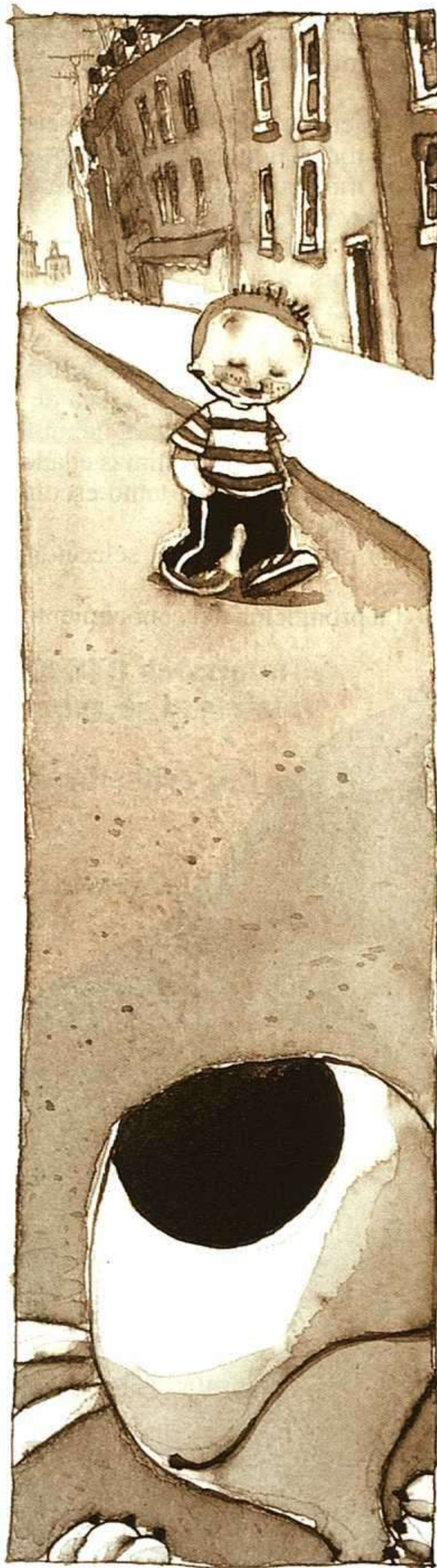
PASCAL BIET, TOM AND POP, BOLOGNA ANNUAL 99.

El Centro de la UCLM dispone de una biblioteca especializada (ubicada en la Biblioteca General del Campus de