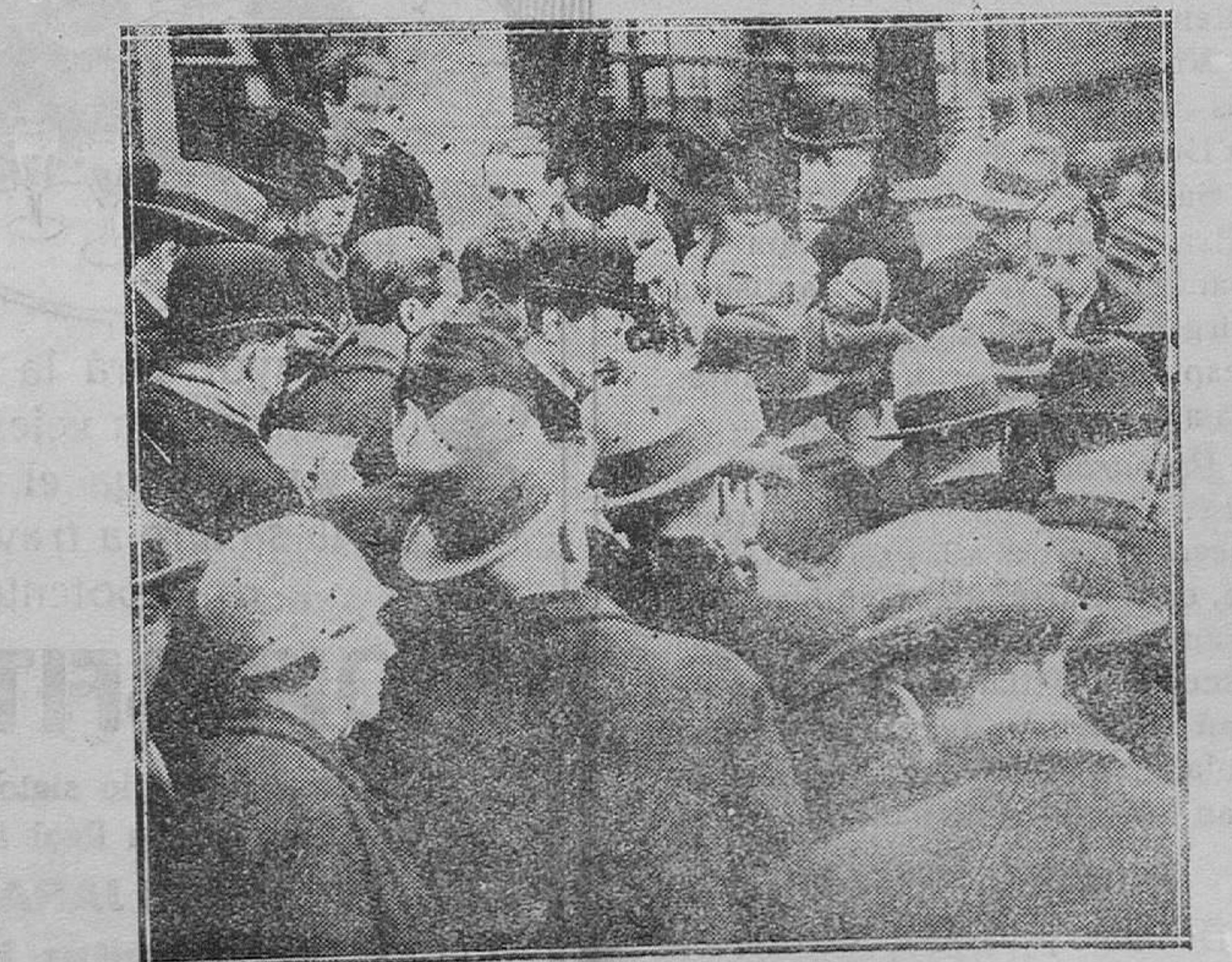
PARIS.—Los periodistas esperando información de la crisis ante el Palacio Eliseo

—Mañana segundo domingo de mes a las siete y media en las Hermanas Carmelitas Misa con exposición de S. D. M. en honor del Ni-