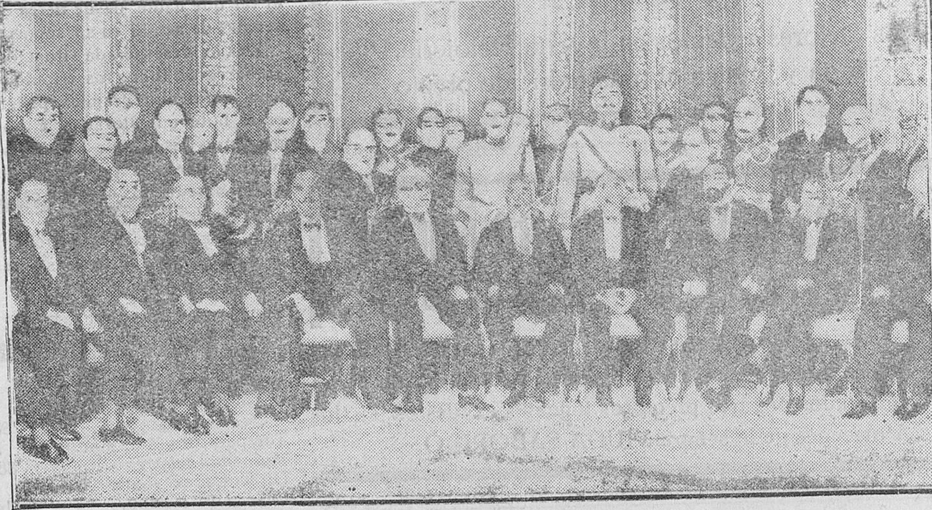
El señor Alcalá Zamora con el Gobierno, su Casa Militar y algunos diputados constituyentes en el Palacio, después del desfile de fuerzas

Por nuestra parte creemos que la solución que propone es la única viable para que las derechas puedan manifestar su fuerza en momento oportuno. ¿Lo comprenden así las menorquinas? Dejemos al tiempo su obra y laboremus sin descanso a tal fin.