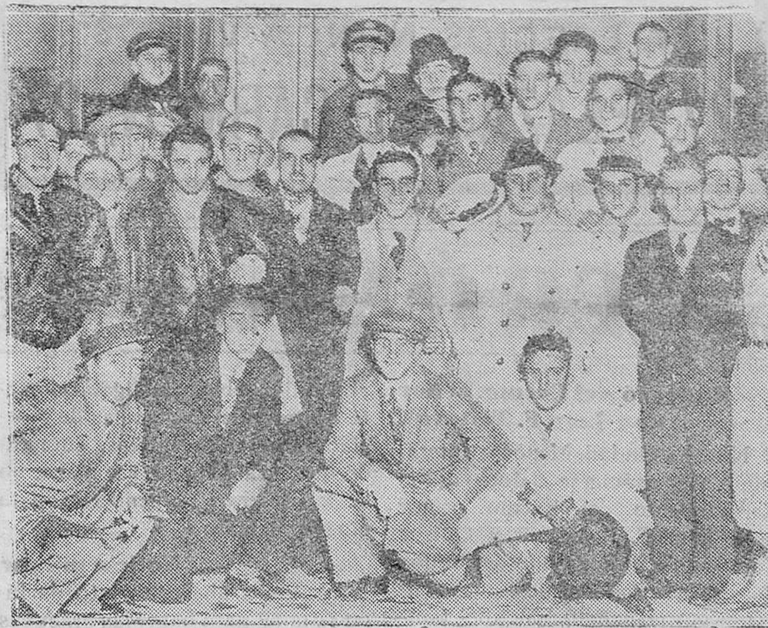
MADRID.—Los jugadores del «Racing» que fueron a América, a su llegada a Madrid

Ya lo ha dicho, con palabra concisa y enérgica, el señor Lerroux: «Reforma agraria socialista, no!» (De «La Nación»)