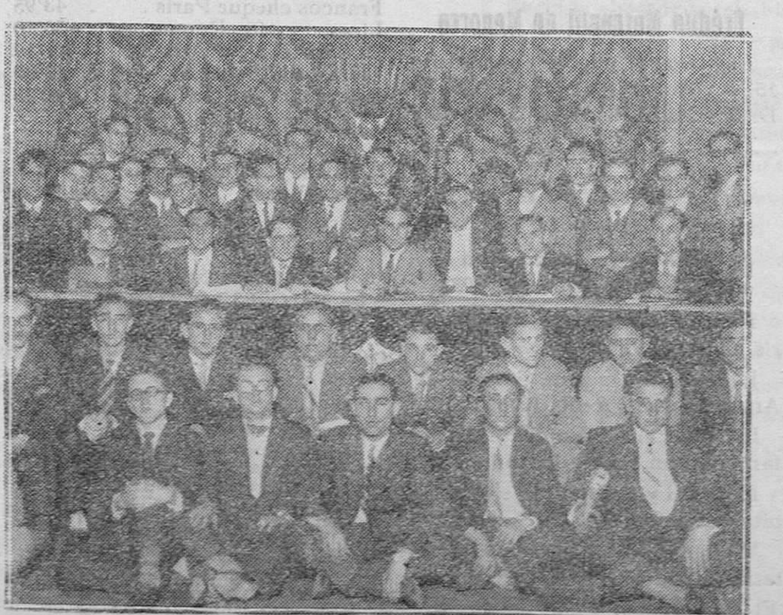
MADRID. — En el Paraninfo de la Universidad Central. — Los delegados de todas las provincias españolas, representantes de los aspirantes al Magisterio Nacional, en la reunión donde tomaron los acuerdos que someten al ministro de Instrucción Pública

Véndese en la Librería de Manuel Sintes Rotger, plaza de Pablo Iglesias 17, Mahón.