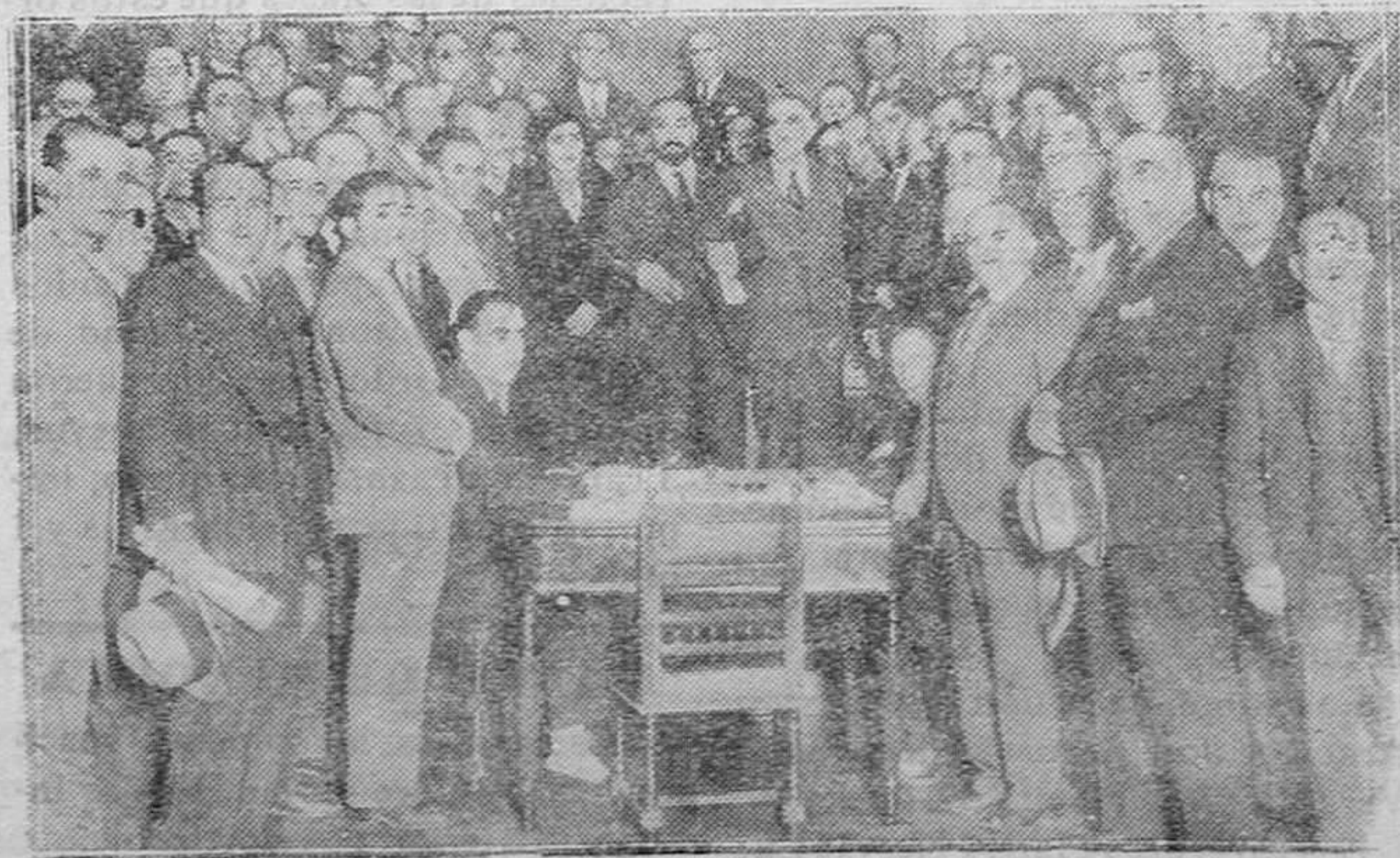
MADRID.—Diputación Provincial.—Clausura de la Asamblea de Prisiones, con asistencia del ministro de Justicia y de la directora de Prisiones.

Mientras estas cosas ocurren, el socialismo espera pacientemente... No ha llegado la hora de su intervención. El socialismo aspira a quedarse con la fábrica, pero con estas dos condiciones: que ya esté hecha, porque el hacerla es más penoso, y que no le cueste nada. Una fábrica, ya montada, en producción y con mercado, y que se obtiene de balde, es una bonita base para un negocio y para demostrar pabelmente las superioridades de la socialización.